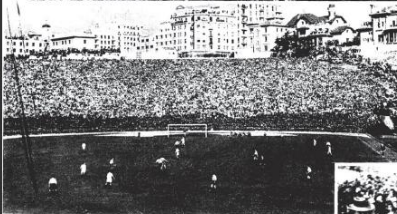
S. E. EL JEFE DEL ESTADO PRESIDIO, ANTEAYER, LA FINAL DEL TORNEO DE FUTBOL, COPA DEL GENERALISIMO

En el Estadio Metropolitano se jugó por el Real Madrid y el Atlético de Bilbao la final de este campeonato. El Caudillo fué aclamado con delicante entusiasmo por los 50.000 espectadores, que le tributaron imponentes ovaciones a su llegada, durante el partido y en el momento de entregar el trofeo al equipo vencedor. Reproducimos en esta página a Su Excelencia saludando a la inmensa muchedumbre que le vitoreaba, un aspecto del campo durante el juego y el instante de la entrega de la Copa.