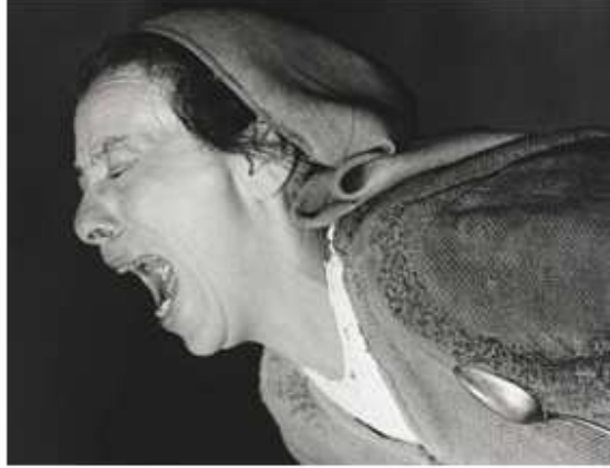
Mère Courage (Hélène Weigel) hurle à la mort de ses enfants.