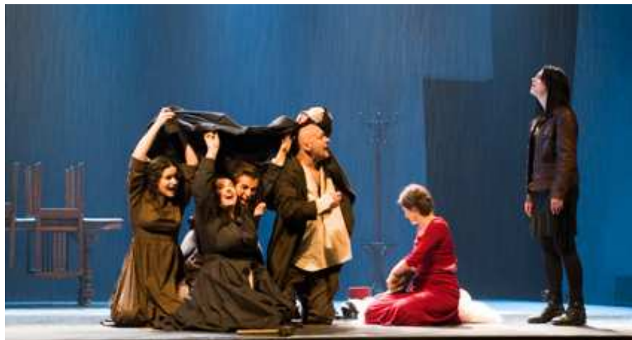
« Pluie en 2006. Pluie en 1943. Pluie en 1873. » Wajdi Mouawad, Forêts , p. 74.

Mémoire de recherche pour le Master Lettres et Arts, spécialité « Arts du spectacle – Théâtre européen »