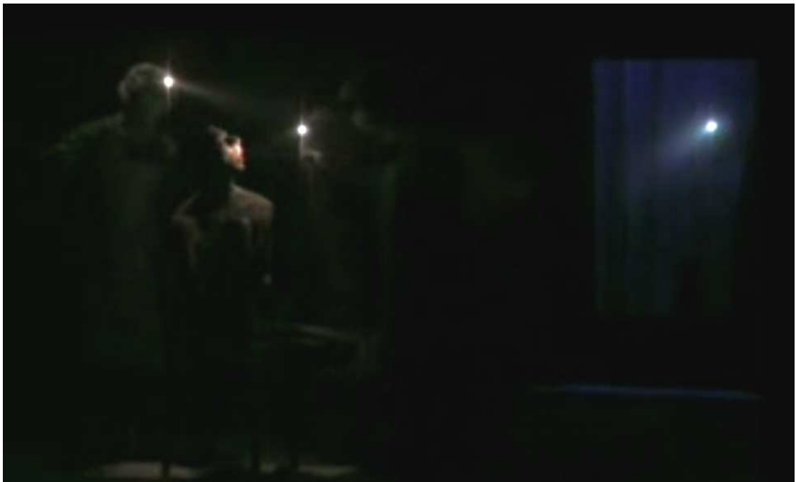
En même temps, les « particules » arrivent près de l'os.

Extraits de la captation du 28 et 29 octobre 2006 au Théâtre 71 de Malakoff.