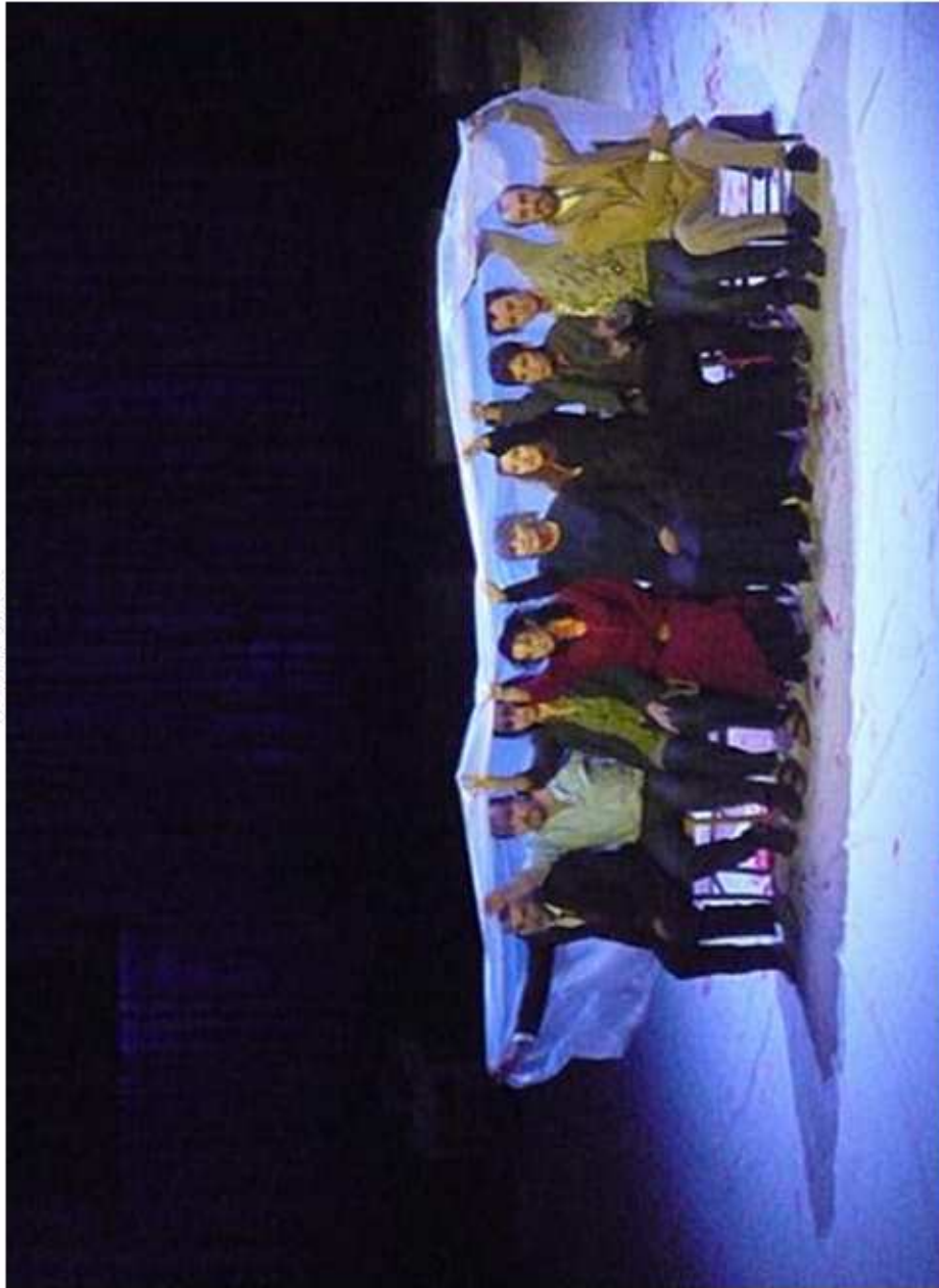
Scène finale de Incendies : pluie sur tous les personnages.