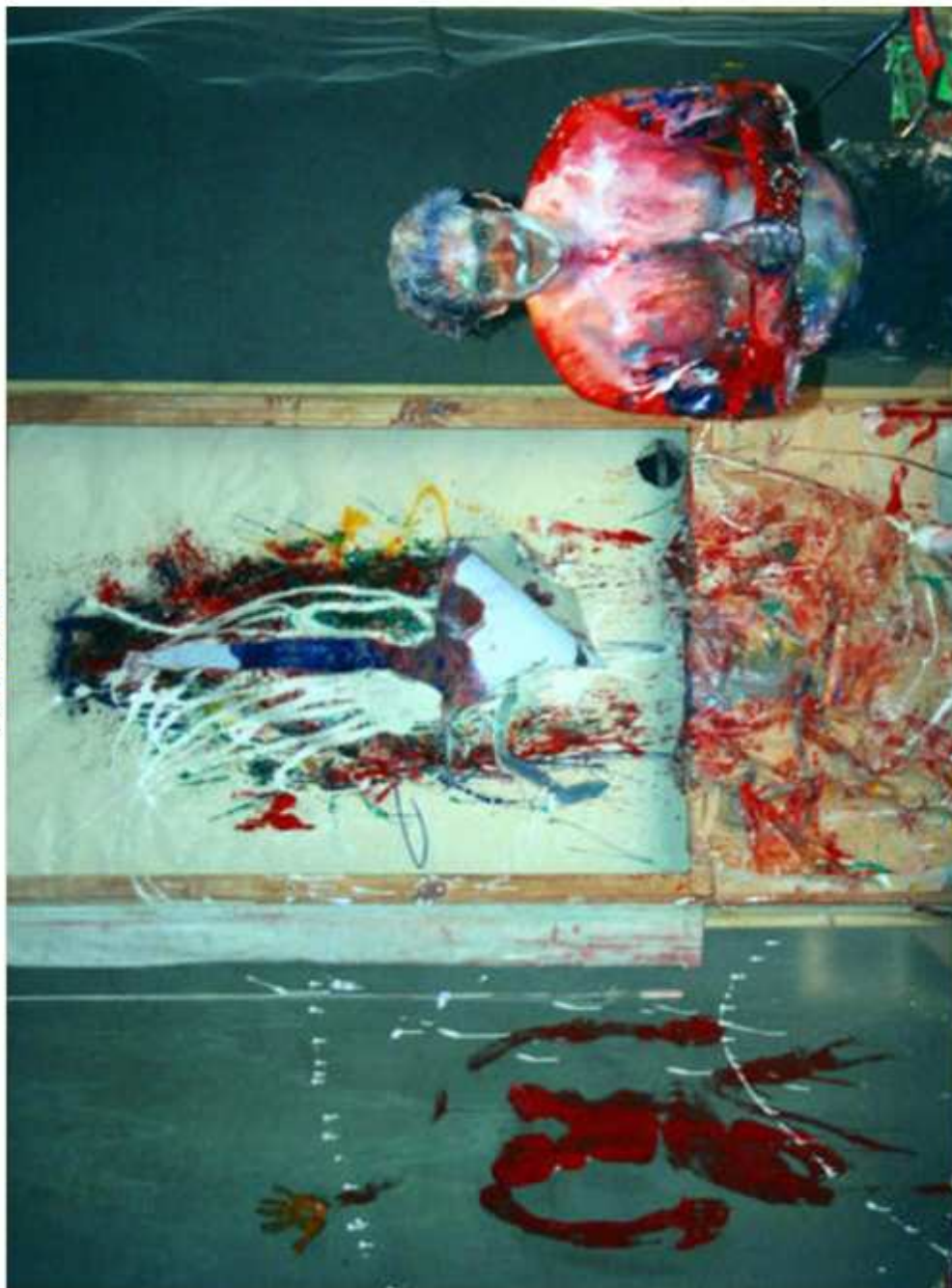
Harwan peint sur les murs, sur lui-même, avec son corps ou des outils.

Crédit : Charlotte Farcet et Irène Afker