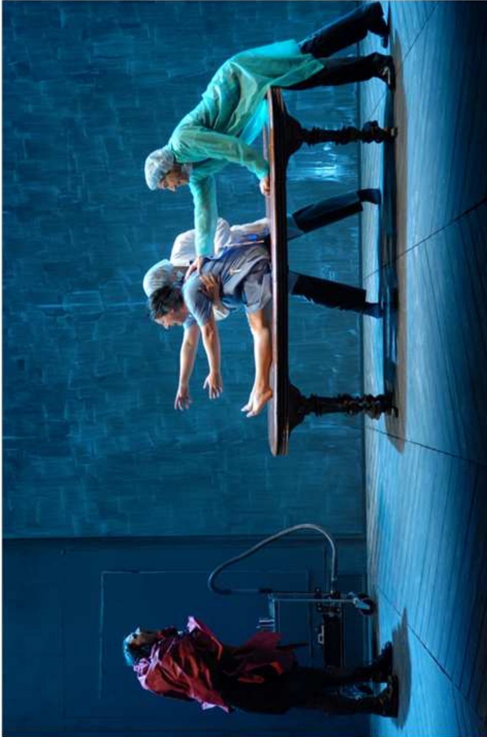
Aimée accouche de Loup.