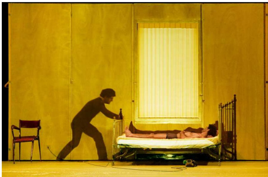
Le personnage image face au personnage matériel. Crédits : Charlotte Farcet et Irène Afker.