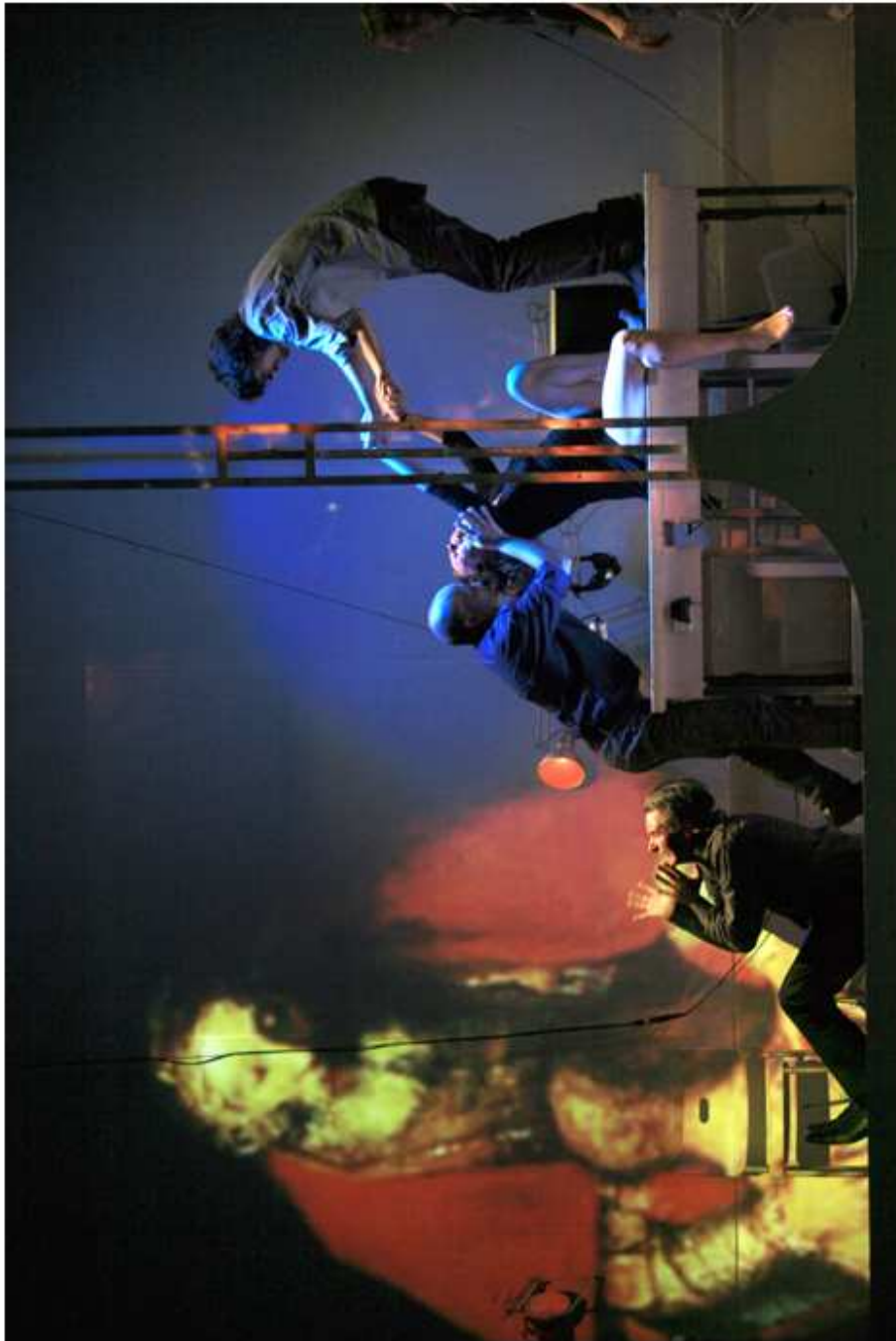
Dolorosa accouche, Charlie hurle, sur fond du diaporama de Victor.