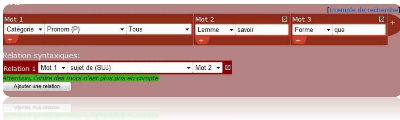
Figure 4 : Requête libre dans Scientext

Il est possible de paramétrer le nombre de résultats voulus, nous avons indiqué une limite à 5000 occurrences afin d'obtenir des informations assez