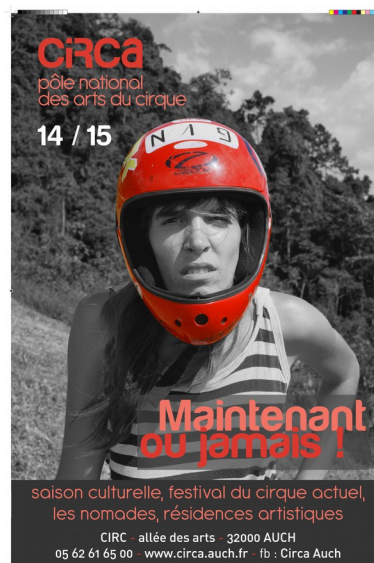
Affiche de la saison 2014-2015 de CIRC a qui embrasse l'identité générale de la structure, Festival et Saison culturelle compris

Cette démarche se veut un contrepoint à l'identité visuelle décrite plus haut et une manière d'embrasser, sur un mode différent, les différentes activités assumées par CIRC a . Reste à déterminer si ce contrepoint ne présente pas un risque de brouillage