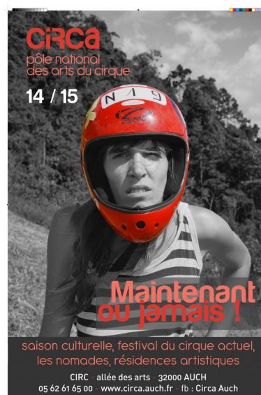
Affiche de la saison 2014-2015 de CIRCca qui embrasse l'identité générale de la structure, Festival et Saison culturelle compris

Cette démarche se veut un contrepoint à l'identité visuelle décrite plus haut et une manière d'embrasser, sur un mode différent, les différentes activités assumées par CIRCca. Reste à déterminer si ce contrepoint ne présente pas un risque de brouillage