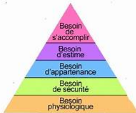
Schéma 2 : Pyramide de Maslow

Ensuite, Maslow AH. et sa théorie humaniste apporte une autre vision de la motivation. Celle-ci serait liée aux besoins principaux de la personne (51). Il construit une pyramide qui permet de connaître les motivations de la personne. Il évoque cinq besoins fondamentaux. Plus le besoin est haut, plus il devient subjectif et difficile à atteindre.