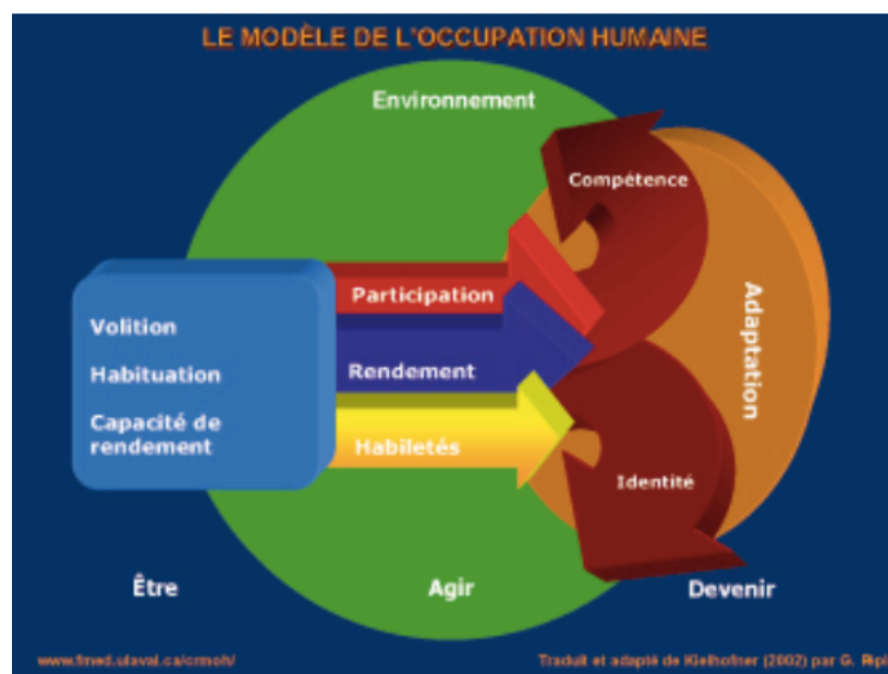
Schéma 3 : Modèle de l'Occupation Humaine

Ce modèle est centré sur l'occupation de la personne qui est une notion au sein de sa participation sociale. Pour cet auteur, l'individu est un être humain et celui-ci est un être occupationnel. L'occupation est essentielle chez la personne, elle permet d'agir et d'augmenter sa participation. Elle se définit comme « différentes activités (productivités, loisirs, vie quotidienne) réalisées dans un contexte physique, temporel et socioculturel ». Le MOH est décrit en 3 parties qui sont représentées par l'Être, l'Agir et le Devenir (53).