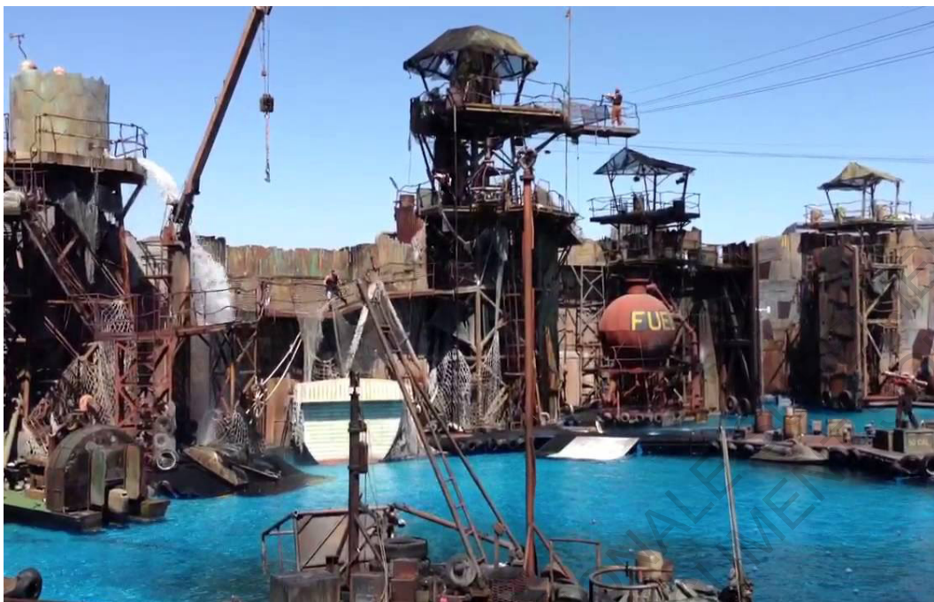
L'atoll Oasis, vue de l'intérieur de la ville (K.Reynold, Waterworld )

Les digues sont l'une des techniques qui permet de ralentir la propagation de l'eau. Lors des apocalypses les survivants trouvent d'autres moyens de se protéger. Lorsque le tsunami submerge New-York dans le film "Le Jour d'après", Sam, le protagoniste se réfugie dans la bibliothèque nationale avec d'autres habitants. Ce bâtiment leur semble résistant face à l'eau qui envahit les boulevards de Manhattan. Ici les anciens bâtiments en pierre sont des remparts face à la progression de l'eau à l'intérieur.