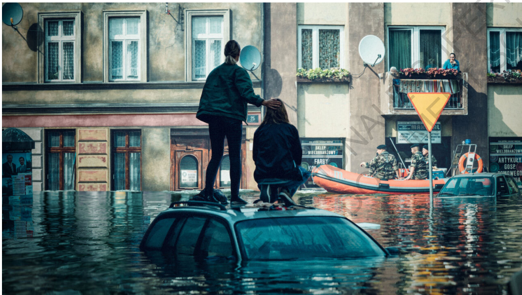
Les voitures comme "îles de repos" lors de la traversée à pied (J. Holoubek, La Crue )

Parfois, la technologie ne suffit plus à subvenir aux besoins de la population lors et post-cataclysme. La société se retrouve confrontée à elle-même, souvent démunie face à la situation. Lorsque la situation le permet, les protagonistes se retrouvent dans de nombreux exemples, à effectuer des traversées à pied. Parfois la hauteur de l'eau prévue ne dépasse pas les chevilles, comme dans la première submersion de Tokyo dans la série animée "Japan Sinks 2020". Il est alors aisé de circuler librement à travers les anciennes rues de la ville. Dans le film "The Storm", le terrain rural est lui plus ou moins vallonné, la hauteur de l'eau varie en conséquence de la hauteur des endroits. Dans certains cas, l'eau a englouti des maisons entières, dans d'autres, les habitants en ont seulement jusqu'aux genoux. Le courant reste quand même globalement fort, notamment dans les premiers moments où l'eau envahit de nouveaux territoires suite à la destruction de la digue et dans les heures et jours suivants, rendant la nage impossible et dangereuse.