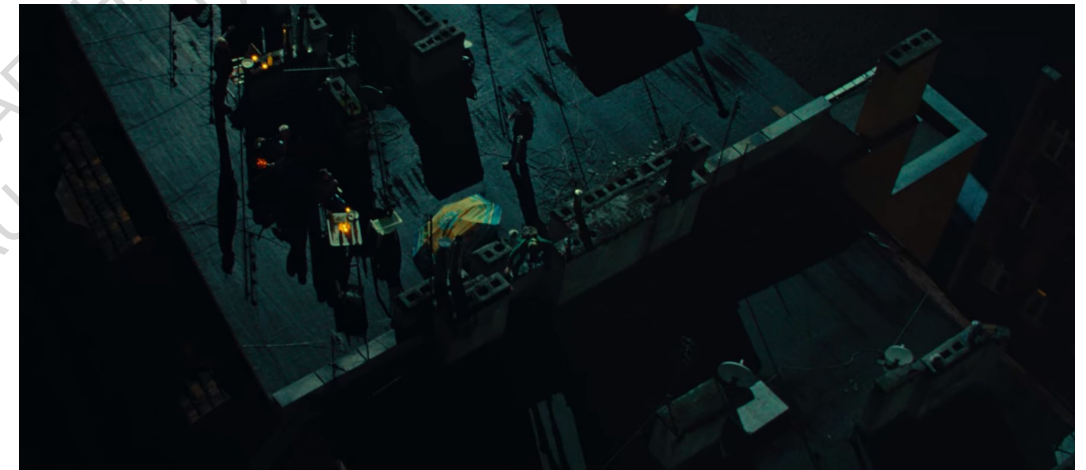
La vie festive nocturne sur les toits des immeubles

espace de rencontre. D'un autre côté, elle opte aussi pour le rôle de place forte militaire lorsqu'ils doivent faire face à l'invasion de la part de Mariner, l'amphibien. Le roman de Kim Stanley Robinson "New York 2140" développe lui aussi des espaces de rencontre sur les toits par le biais de jardins publics, parfois sous de grandes serres, rendant possible la découverte de la "nature" artificialisée issue du passé pour la nouvelle génération de population. Il est possible de pratiquer diverses activités physiques dans ces espaces enherbés.