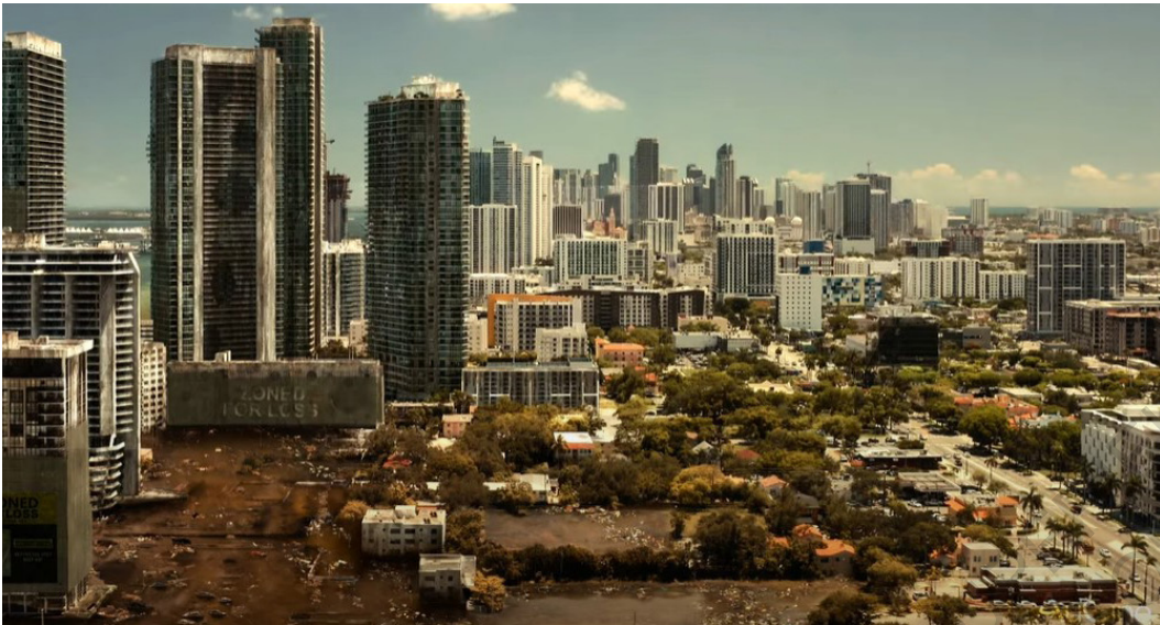
La ville de Miami en partie inondée et vivant avec les marées (S. Z. Burns, Extrapolations )

expériences se déroulent dans le même bâtiment. Le quartier du Lower Manhattan est devenu un véritable foyer de théorie et de pratique. Cette idée est déjà véhiculée à propos de cette zone, mais serait enfin réelle avec de vraies propositions fortes et sur lesquelles la population peut s'appuyer et se servir.