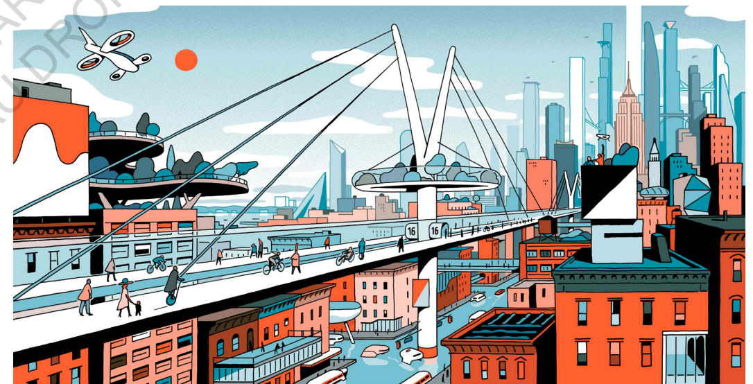
Nouveaux axes pédestres au-dessus de l'eau, dans les rues de New York (Vincent Mahé, illustration suite au roman New York 2140 )

Certains exemples dévoilent la possibilité pour les survivants de se servir de ce qui existe encore en ville pour transiter entre deux endroits. Dans la série japonaise "Japan Sinks" des portions de route sont bien plus hautes que le niveau projeté de l'eau. La traversée est alors possible, en surplombant la catastrophe. Dans la série polonaise "La Crue", certains survivants comme l'hydrologue Jasmina Tremer et sa fille Klara se retrouvent bloqués dans les rues face à la montée du niveau de l'eau. Dans cette situation, le toit des voitures garées émerge comme des îles de sécurité au milieu de la submersion. A la manière de bouées, elles leur permettent de survivre et de se reposer lors de la traversée, tout en les mettant en sécurité.