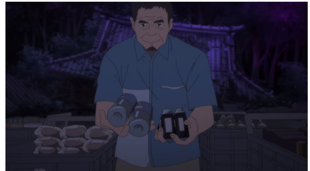
Distribution de provisions de façon équitable (P-Y. Ho et M. Yuasa, Japan Sinks 2020 )

Dans la situation d'une submersion de la ville, la ressource continue d'avoir son importance dans la société. Les réserves primaires et essentielles à la survie de la population sont menacées. En effet, les modes de vie sont perturbés de façon brutale. La population n'est que peu préparée en amont face à de tels cataclysmes. Le ravitaillement est souvent nécessaire pour faire face aux différentes crises vécues. L'armée en est dans de nombreux exemples en charge. Dans la série "La Crue", elle délivre aux habitants par voie navigable, des rations de nourritures. Des systèmes de grutage sont alors mis en place pour permettre à la population d'accéder aux denrées depuis leurs fenêtres. Dans la série "Japan Sinks 2020", l'armée s'occupe elle aussi de la livraison de produits, mais cette fois par le biais d'hélicoptères larguant des paquets. Des camps sont aussi installés pour que la population puisse se retrouver et bénéficier de soins pour les blessures. Ces camps profitent de grands espaces tels que les cours d'école pour s'établir.