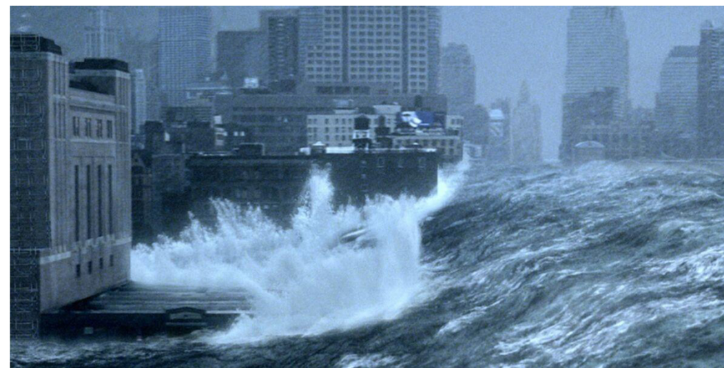
Un tsunami frappant New-York, suite à un dérèglement climatique majeur (R. Emmerich, Le Jour d'après )

construction de digues paraît comme étant la plus évidente. Dans la série "La Crue", la volonté de limiter la propagation de l'eau en ville se fait par l'intermédiaire de sacs de sable. Cet amas aurait le rôle d'une digue construite par les habitants qui se rendent assez vite compte qu'elle ne sera pas suffisante face à l'ampleur du chaos. Le film "The Storm" montre lui des habitants de la province de Zélande parés aux raz de marée. En effet, des digues provisoires et démontables en bois sont prévues dans les rez-de-chaussée des bâtiments importants, comme la salle des fêtes. Les structures sont pérennes et réutilisables, les planches de remplissage sont enlevables. Ces armatures sont prévues lors de submersions mineures. En effet, lorsque la digue principale le long du rivage s'effondre, elles ne sont plus capables de bloquer l'eau. Parfois les digues jouent le rôle inverse et retiennent l'eau. Dans "La Crue" les digues ont modifié le lit naturel de la rivière. Celles-ci retiennent alors l'eau qui souhaiterait retrouver son tracé antérieur et se retrouve bloquée. Dans la série "Extrapolations", il est indiqué que la ville de Mumbai a été sauvée de la montée des eaux grâce à une digue au large de la ville. Dans le scénario, cette ville a été condamnée mais elle a été choisie comme une zone à préserver.