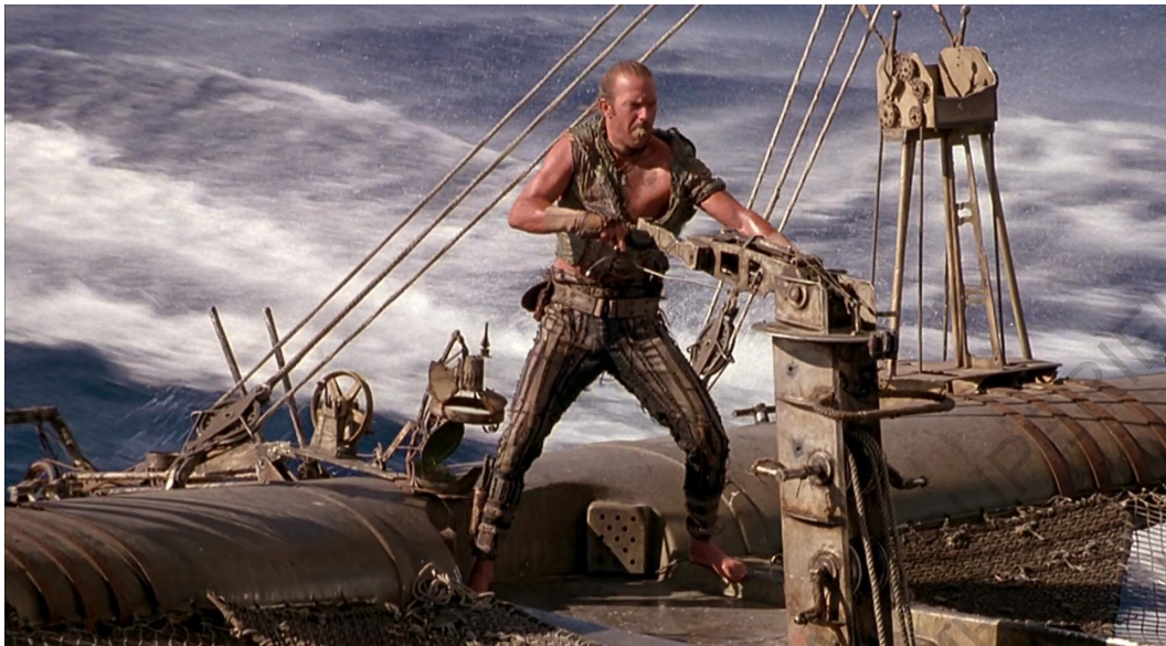
Le navire du protagoniste, Mariner (K. Reynold, Waterworld )

d'habitudes de la part des habitants, notamment dans les grandes métropoles américaines. En effet, c'est le cas à Miami dans la série "Extrapolations". Dans ce scénario, cette ville serait touchée par une submersion temporaire et cyclique. Dans cette hypothèse, l'usage de la voiture reste possible lorsque les conditions pour circuler sont favorables. Les routes sont alors toujours praticables et les habitants peuvent continuer à utiliser leurs véhicules personnels, sans changer de paradigme face à nos villes actuelles.