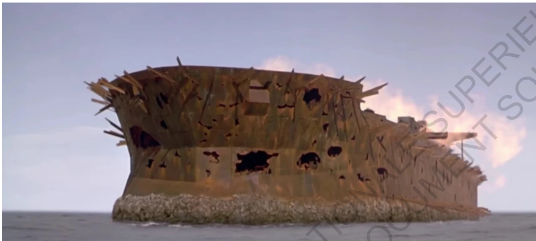
L'EXXON VALDEZ, pétrolier et refuge des pirates smokers (K. Reynolds, Waterworld )

à la submersion a été de monter dans les étages des bâtiments existants. Les habitants des premiers étages ont été rapatriés vers le haut par tous les moyens possibles, tout comme les patients de l'hôpital. La vie est inversée, il est possible de "descendre" chez soi et non de monter chez soi maintenant. L'entrée des immeubles se fait par le haut et non par les entrées classiques des immeubles. Les escaliers de secours extérieurs, le long des bâtiments, servent eux à faire l'ascension, du niveau de l'eau vers le toit et inversement. A Londres, dans le scénario du roman "Le monde englouti", la vie se fait maintenant dans les derniers étages des immeubles. Dans la partie basse de la ville, avec l'humidité et la chaleur avoisinant les 50°C constamment, une faune tropicale telle que des lézards ailés et des iguanes se sont installés et ont pris le contrôle de cette partie de la ville. Le "haut" des immeubles est donc devenu le seul endroit sûr pour les derniers survivants.