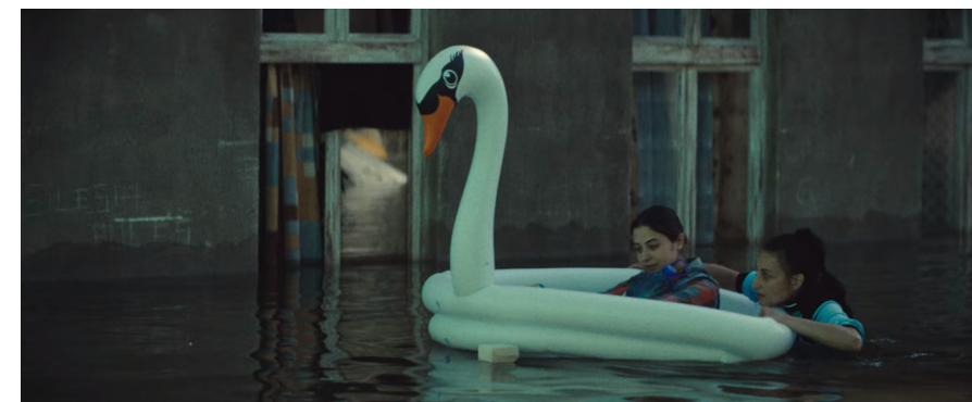
Embarcation de fortune, ici une bouée de piscine pour voyager (J. Holoubek, La Crue )

2 - Robinson, K.S. (2017). New York 2140. Orbit, New York . 613p.