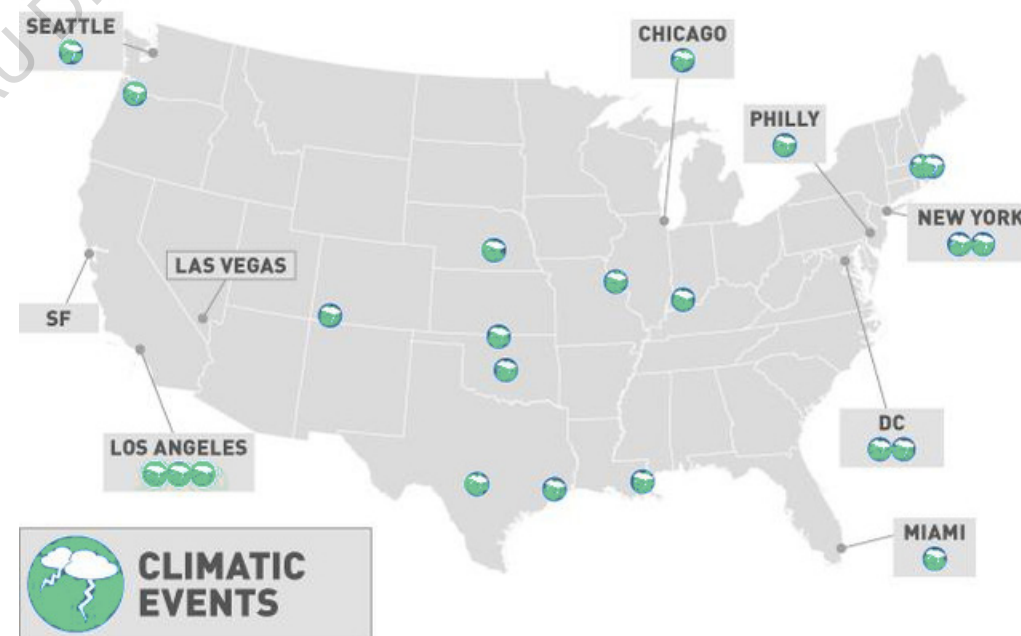
Carte des villes les plus touchées aux Etats-Unis par des événements climatiques dans les films de science-fiction (Blog The Concourse, 2014)

Les auteurs et réalisateurs d'œuvres de science-fiction prennent l'habitude de replacer leurs apocalypses ciblées à certaines villes dans un contexte global, souvent liés au réchauffement climatique lorsque l'on s'intéresse à la submersion des villes. En effet, ces catastrophes localisées ne sont que des exemples face à l'ampleur mondiale du cataclysme. Peu de zones de la planète sont exclues de toute catastrophe à leur égard. Certains films et séries mettent en avant divers exemples afin de sensibiliser sur la pluralité de la catastrophe et son aspect global. C'est le cas de "2012" ou de la série "Extrapolations". Dans celle-ci, on découvre l'impact d'un réchauffement climatique global à différentes périodes et à divers endroits de la planète, montrant qu'aucun n'est épargné.