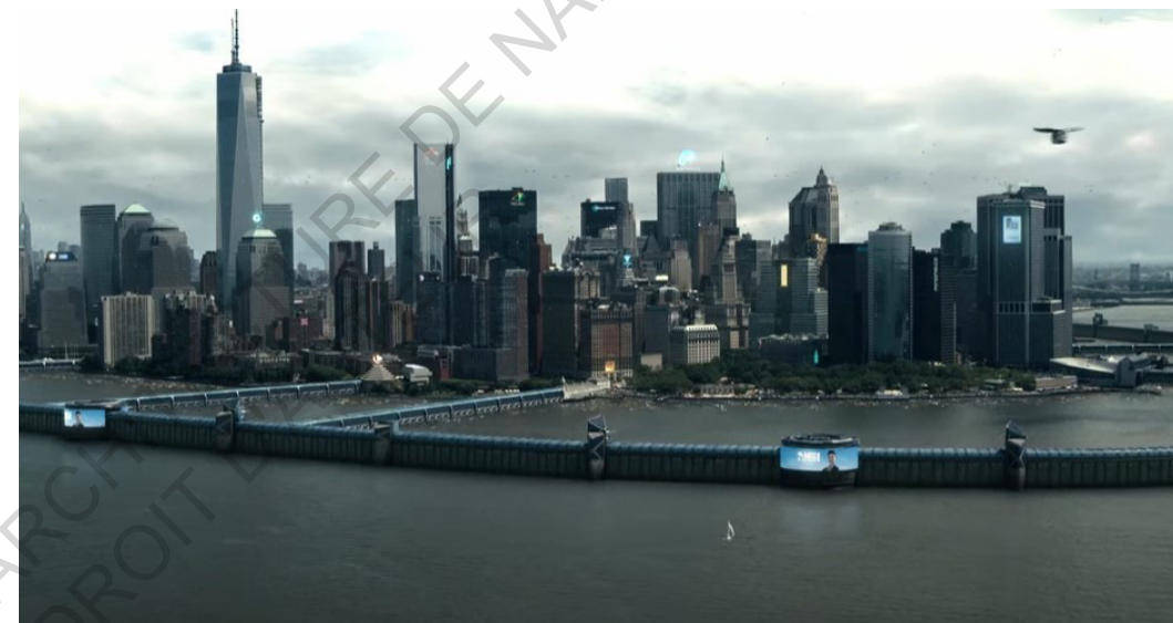
La ville de New-York encerclée par une digue géante (S. Z. Burns, Extrapolations )

Dans le film "Waterworld", les villes se sont construites sur les restes de l'ancien monde, même dans l'ignorance de l'ancien monde. Certaines reprennent le modèle des villes médiévales. En effet, les nouvelles civilisations ont créé des atolls artificiels au milieu de la vaste étendue d'eau qui a recouvert le monde. Ces villes sont des forteresses, encerclées par une muraille abritant les habitations et fermée par une entrée majestueuse pour l'arrivée des bateaux.