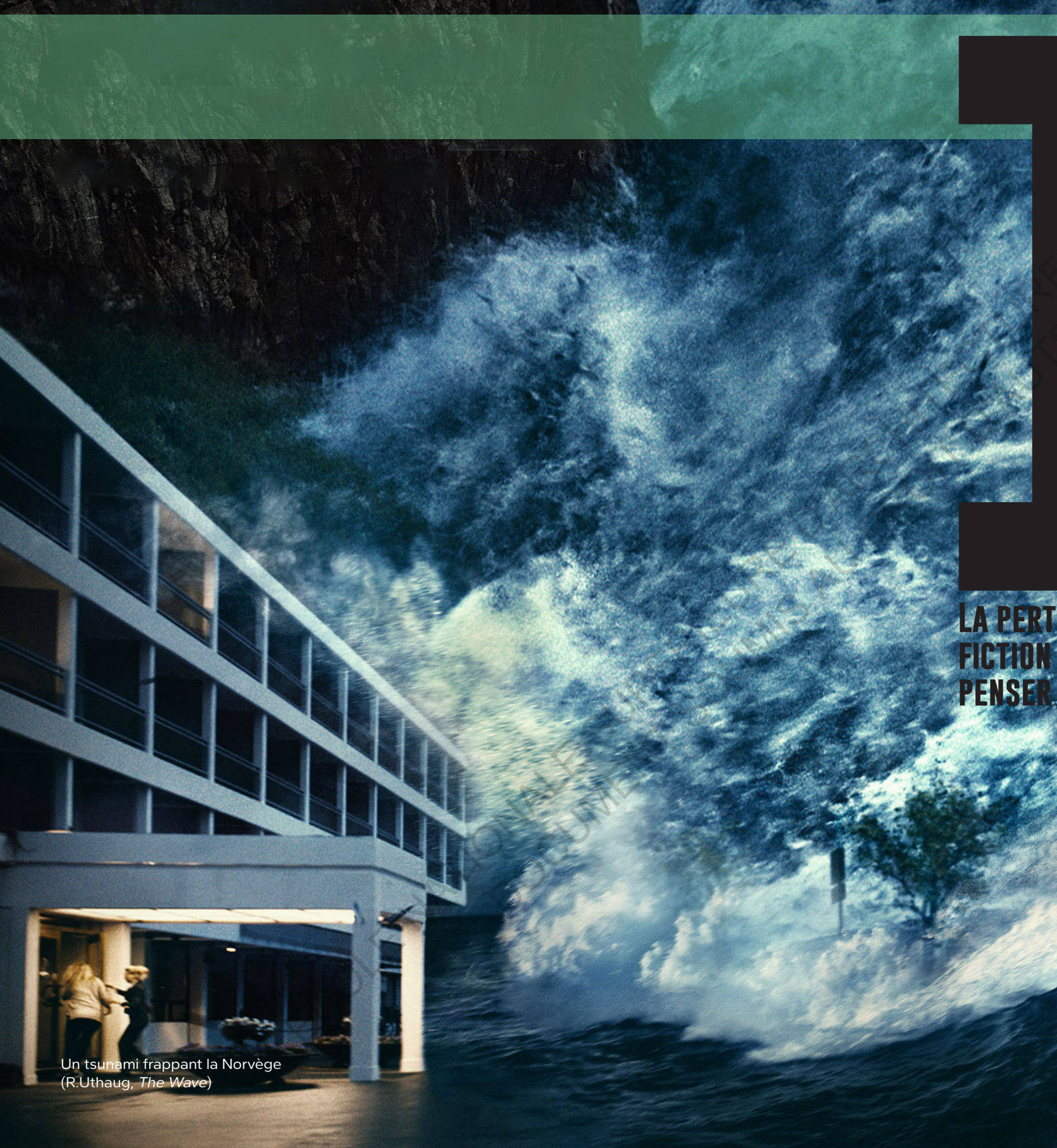
Un tsunami frappant la Norvège (R.Uthaug, The Wave )