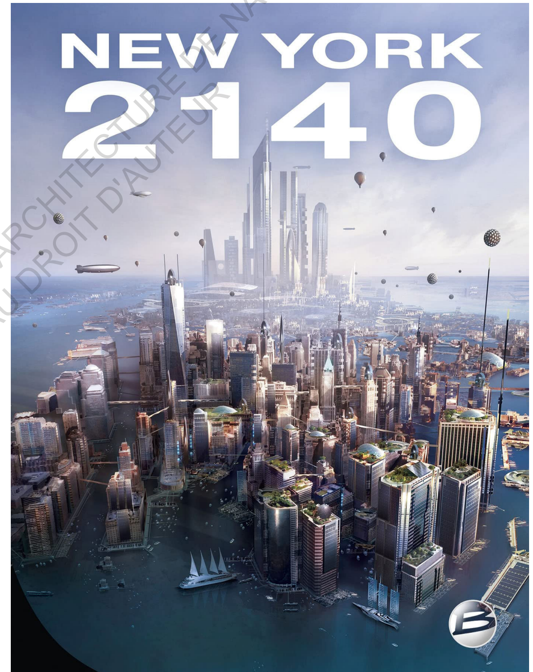
De nombreux quais et véhicules volants entre les tours de New York (K. S. Robinson, New York 2140 )

Dans une optique de limiter le contact avec l'eau, d'autres moyens de transport sont développés, notamment dans les airs. Les pirates du film "Waterworld" utilisent notamment de vieux avions qu'ils ont réparés pour circuler plus facilement au-dessus de l'océan et leur offrant l'effet de surprise sur leurs adversaires. Dans le roman "New York 2140", la ville est traversée par de multiples couloirs aériens au-dessus et entre les tours. L'auteur imagine le retour de l'utilisation massive des ballons dirigeables, supérieure même à l'âge d'or du zeppelin lors de l'entre-deux guerres. Entre les centaines de dirigeables qui survolent la ville, les montgolfières s'ajoutent. Ces deux moyens de déplacements permettent de naviguer entre les anciens et nouveaux gratte-ciels de Manhattan. Les tours voient donc des quais sur leurs façades apparaître pour permettre à ces nouveaux taxis de transiter et de déposer les habitants.