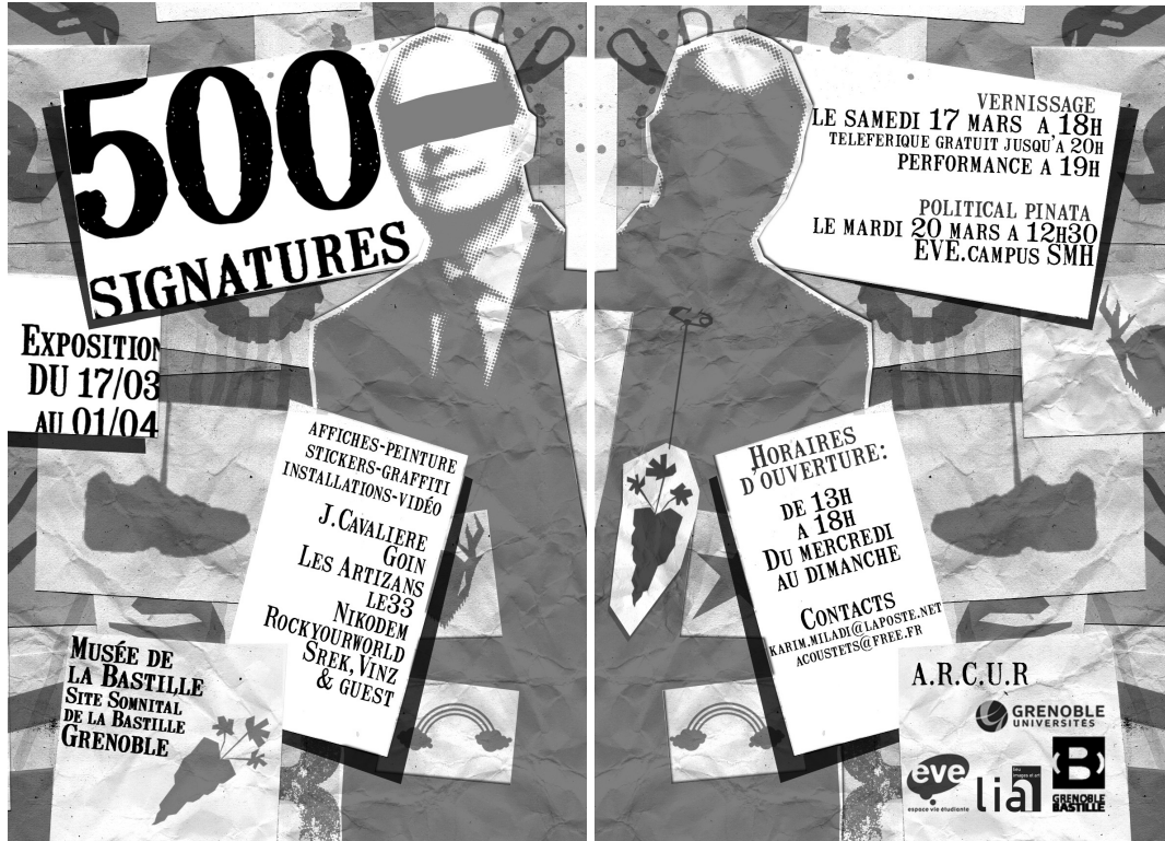
Recto et verso du flyer de l'exposition « 500 signatures »