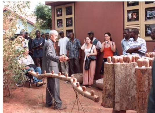
Atelier sculpture a Accra, Ghana, mars - avril 2004