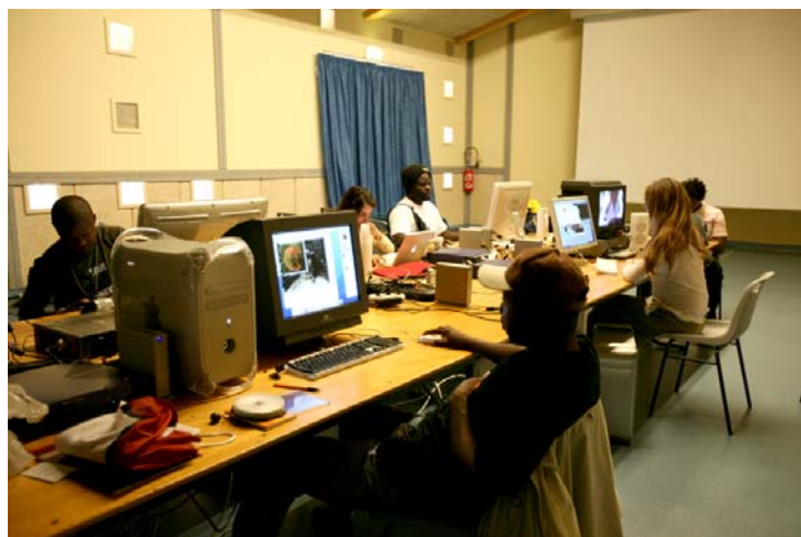
Atelier vidéo à Joucas, juin 2007