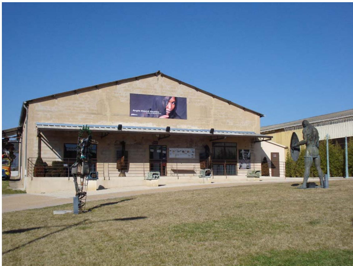
Centre d'art de la fondation Jean-Paul Blanchère