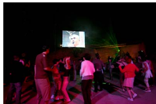
Atelier vidéo à Joucas, juin 2005