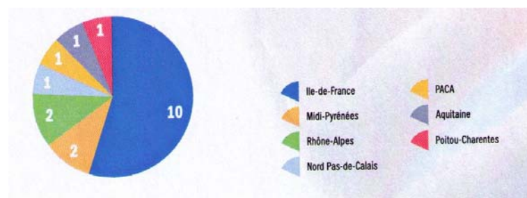
Nombre de fondations d'entreprise créées en 2004 et 2007, réparties par régions. Etude Ernst & Young, 2007