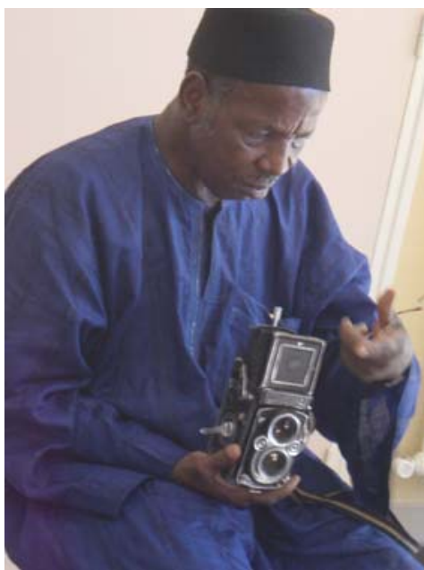
Malick Sidibé à Joucas, 2005