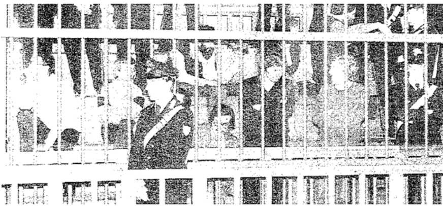
Torino, processo alle Br, 1983