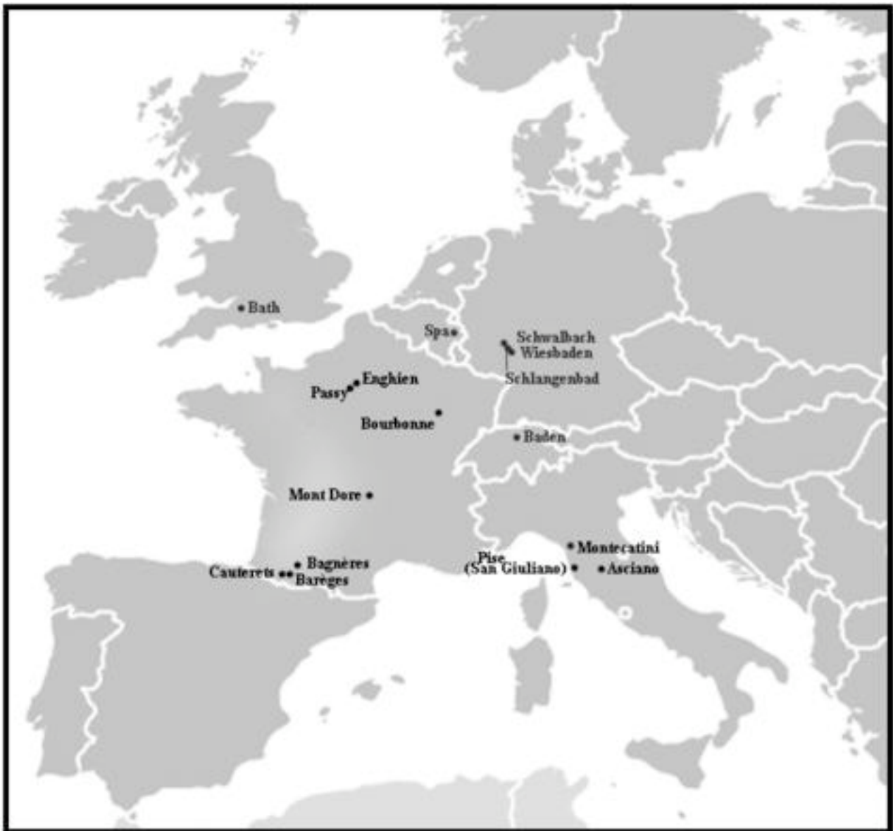
Carte des stations thermales étudiées