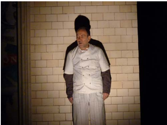
Deux Boulangers. Pierre Tarrare