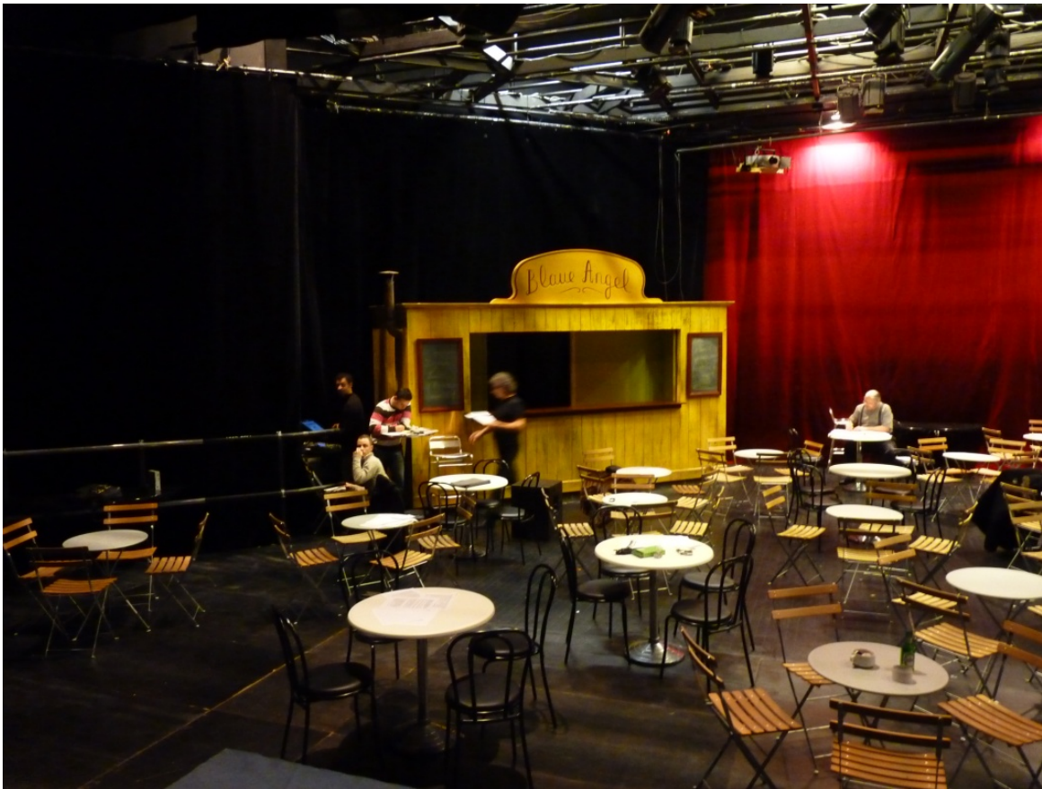
5 Dernières mises au point entre le metteur en scène et l'équipe technique.

Ensuite, l'étape qui permet de construire vraiment le décor, d'y ajouter une forme de vie, c'est l'installation des lumières. Le créateur lumière a donc pour but à la fois de créer l'atmosphère adéquate au spectacle (comme la lune au dessus du bordel, ou encore les lampadaires), mais aussi de mieux mettre en valeur les comédiens (comme le jeu se fait sur différents niveaux, les projecteurs doivent être adaptés aux comédiens afin d'éclairer leur visage), et enfin de créer le jeu avec le public (lumière d'ambiance sur les tables, progression de la lumière entre le repas et les scènes, etc). Ainsi, de même que change le déroulé, le plan de feux s'adapte ; et parfois, le déroulé s'adapte à la lumière. Ainsi, certaines propositions de mise en scène étaient rejetées par le créateur lumière, et en particulier les passages parmi le public pendant des scènes qui ne permettaient pas de remettre la lumière de salle -pour cacher une préparation dans un autre espace, ou bien pour maintenir un peu l'illusion. Par exemple, l'avancée de Sainte Jeanne, seule dans la lumière a été maintenue pour accentuer le côté pathétique de cette scène, mais l'arrivée de Gobbola par le public étaient trop risquée dans le noir complet, et une lumière aurait fait perdre l'effet de surprise à l'apparition d'Arturo Ui. Donc, la lumière permet l'identification de chaque espace, ce qui est particulièrement important dans ce spectacle