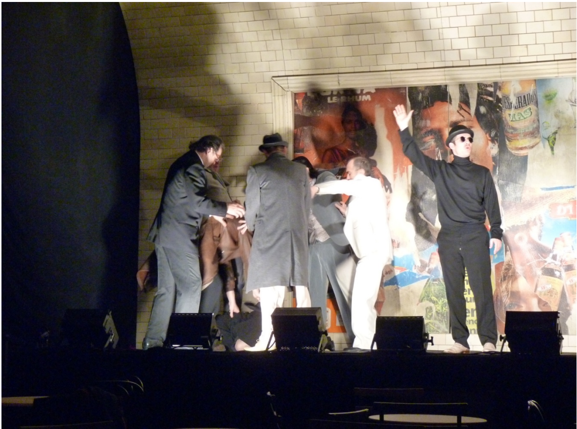
7 Sainte Jeanne des Abattoirs. La mise à mort de Jeanne Dark.

Il semble donc que les comédiens ont le pouvoir de faire dire au décor ce qu'ils veulent, et que les multiples capacités de cet espace n'enlèvent rien à la créativité et au travail d'imagination des artistes et des spectateurs.