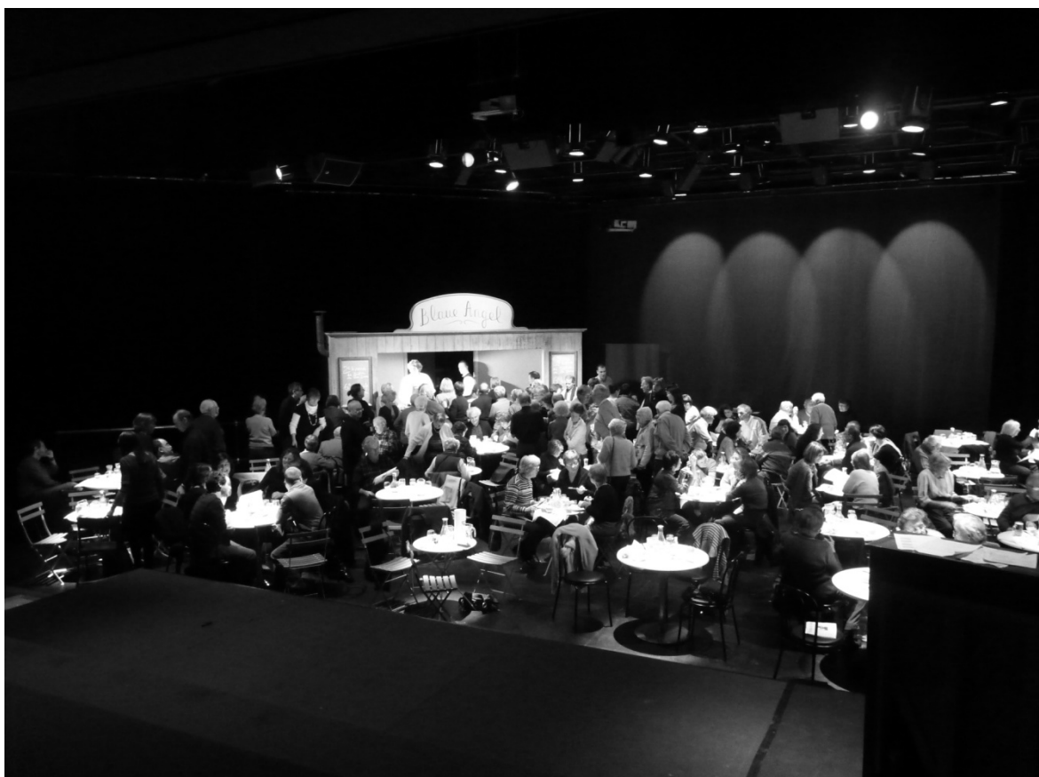
9 Choucroute! Les spectateurs vont chercher leur assiette à la baraque à frites, et en profitent pour discuter.

Néanmoins, le dispositif crée également des petits groupes par tables, et l'effet de masse regardant dans la même direction est atténué. Et on peut se demander si chacun est égal face aux propos tenus... rien n'est moins sûr en effet, puisque la salle compte des connaisseurs, autant que des novices, sur lesquels la prise de position du metteur n'aura pas le même effet : elle peut ainsi être contestée ou acceptée comme naturelle. En outre, cette prise de position politisée peut également provoquer différentes réactions chez les spectateurs (bien qu'on ne s'attende pas à compter des membres du front national parmi les spectateurs de l'amphithéâtre, on a conscience que tous ne peuvent pas être marxistes).