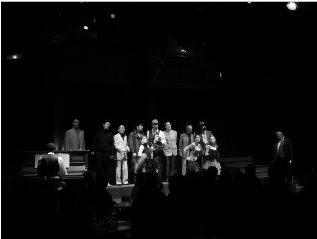
La complainte de Mackie