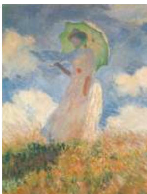
La femme à l'ombrelle (Monet)

Les premières pages nous peignent déjà une Jeanne se livrant à des rêveries euphoriques, une jeune femme « radieuse, pleine de sèves et d'appétits de bonheur » dont la joie est « délirante » (I, p.7). D'ailleurs, on a souvent pu comparer Jeanne à La femme à l'ombrelle , peinte par Monet.