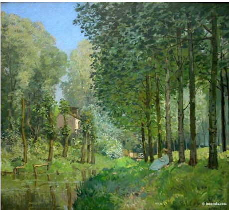
Le repos au bord du ruisseau (Sisley)

Soulignons, par ailleurs, que le parfum comme porteur d'une véritable nature et surtout de mémoire nous a rappelé un extrait des Mémoires d'Outre-tombe de Chateaubriand que nous ne résistons pas à citer : « Dans ce parfum non respiré de la beauté, non épuré dans son sein, non répandu sur ses traces, dans ce parfum chargé d'amour, de culture et de monde, il y avait toutes les mélancolies des regrets, de l'absence et de la jeunesse 67 ».