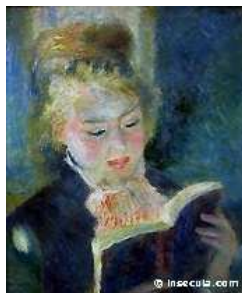
La liseuse (Renoir)

« Un livre n'a pas d'auteur, mais un nombre infini d'auteurs. Car à celui qui l'a écrit s'ajoutent de plein droit dans l'acte créateur l'ensemble de ceux qui l'ont lu, le lisent ou le liront. Un livre écrit, mais non lu, n'existe pas pleinement. Il ne possède qu'une demi-existence. C'est une virtualité, un être exsangue, vide, malheureux qui s'épuise dans un appel à l'aide pour exister. L'écrivain le sait, et lorsqu'il publie un livre, il lâche dans la foule anonyme des hommes et des femmes une nuée d'oiseaux de papier, des vampires secs, assoiffés de sang, qui se répandent au hasard en quête de lecteurs. A peine un livre s'est-il abattu sur un lecteur qu'il se gonfle de sa chaleur et de ses rêves. Il fleurit, s'épanouit, devient enfin ce qu'il est : un monde imaginaire foisonnant, où se mêlent indistinctement - comme sur le visage d'un enfant, les traits de son père et de sa mère - les intentions de l'écrivain et les fantasmes du lecteur 276 ».