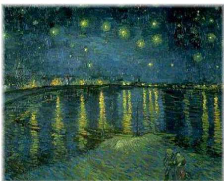
La nuit étoilée (Van Gogh)

[...] et elle sentait entre elle et lui comme un voile, un obstacle, s'apercevant pour la première fois que deux personnes ne se pénétraient jamais jusqu'à l'âme, jusqu'au fond des pensées, qu'elles marchent côte à côte, enlacées parfois, mais non mêlées, et que l'être moral de chacun de nous reste éternellement seul pour la vie. (UV, V, p.54)