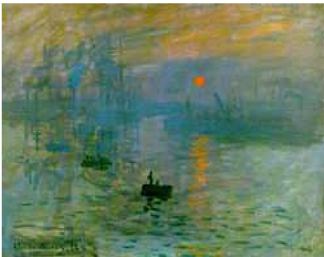
Monet : Impression soleil levant