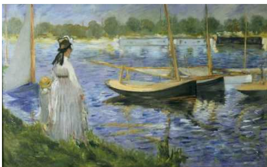
Les rives de la Seine à Argenteuil (Monet)

Nous venons d'évoquer la mer et, bien entendu, nous pouvons y rattacher la barque, motif récurrent dans l'œuvre maupassantienne et dans Une vie notamment. Nous pouvons déjà constater que cette dernière est souvent personnifiée comme les barques dans le premier chapitre dont il est dit : « Les barques du pays, halées sur la pente de cailloux ronds, reposaient sur le flanc, tendant au soleil leurs joues rondes vernies de goudron. » (I, p.16) Et d'ailleurs, la barque est même nommée : comme la Jeanne dont on assiste au baptême.