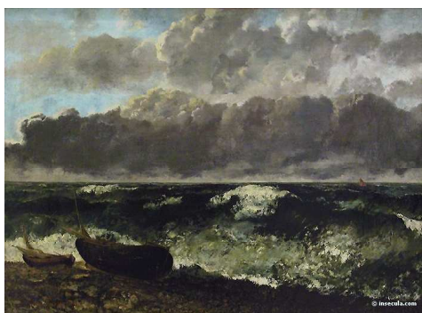
La mer orageuse (Courbet)

Et bien entendu nous ne pouvons pas évoquer le symbolisme de l'élément aquatique sans considérer la mer. L'eau maritime occupe une place trop importante dans l'œuvre pour que nous ne nous penchions pas sur elle.