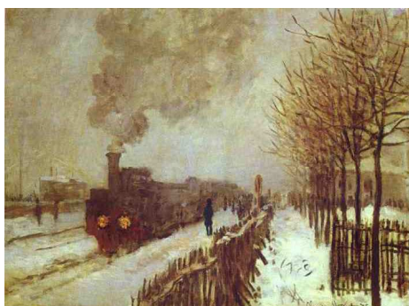
Train dans la neige (Monet)

locomotive notamment. On lit bien, dès lors, son ignorance devant le progrès qu'elle subit passivement comme elle subit tous les petits faits qui meublent sa vie. Son effroi devant le train, de même que sa méconnaissance devant cette « machine noire » passe par la personnification et l'animalisation de cette même locomotive ainsi que par le flou de la description (pronom démonstratif, dénomination imprécise) qui oblige le recours à la métaphore.