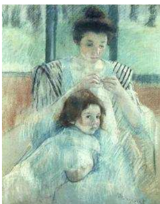
Mother and child

La famille apparaît bien, avec ce nouvel adultère, comme le lieu de la trahison, de l'étouffement, de tensions, de conflits, un lieu où la vacuité des sentiments est évidente, un lieu qui n'est qu'une source constante de chagrin. Son mari la trahit, sa mère la trahit et son fils la trahira dans une certaine mesure. C'est d'ailleurs sur lui le fils de Jeanne que nous allons reporter notre attention.