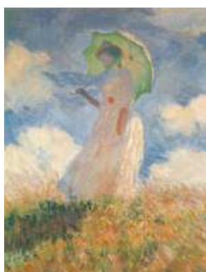
La femme à l'ombrelle (Monet)

Les premières pages nous peignent déjà une Jeanne se livrant à des rêveries euphoriques, une jeune femme « radieuse, pleine de sèves et d'appétits de bonheur » dont la joie est « délirante » (I, p.7). D'ailleurs, on a souvent pu comparer Jeanne à La femme à l'ombrelle , peinte par Monet.