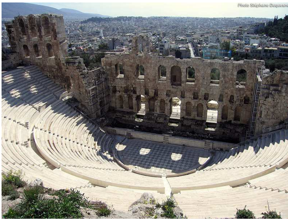
Le théâtre de Dionysos à Athènes