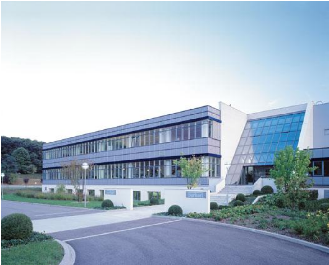
Bürkert Triembach au Val

En plus de ces différentes usines, le groupe possède 5 sites dédiés à l'activité de systèmes qui permet de développer des produits sur mesure pour leurs différentes utilisations et les différents clients. Ces 5 sites sont appelés les « systemhaus » et sont :