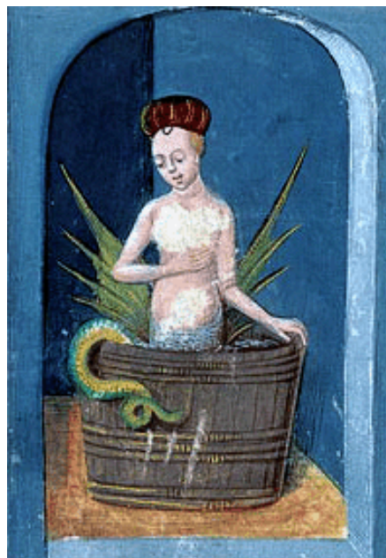
Mélusine par Guillebert de Mets (1410)

Tous les samedis tu seras serpente du nombril jusqu'au bas du corps. Cependant, si tu trouves un homme qui veuille t'épouser et promette de ne jamais te voir le samedi, de ne pas chercher non plus à découvrir qui tu es, ni de parler de cela à personne, alors tu vivras le cours naturel de la vie comme une femme douée de nature humaine et tu mourras naturellement. [...] mais sache le bien, si ton union avec ton mari est rompue, tu retourneras éternellement à ton tourment originel qui ne cessera que lorsque le Juge souverain siègera. 47