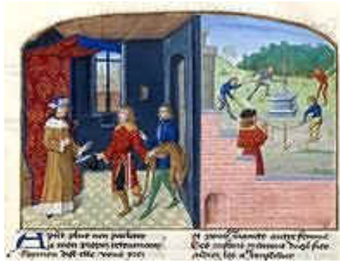
Raymondin et la peau de cerf.

(Bibliothèque de France, Ms Fr 24 383, fol. 7).