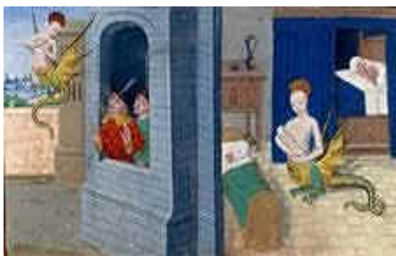
Mélusine berce son nouveau-né

(Bibliothèque de France, Ms Fr 24 383, fol. 30).