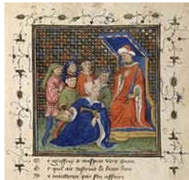
Les adieux de Mélusine et de Raymondin (Mélusine s'évanouit après avoir été insultée par son mari) Bibliothèque de France, ms Fr. 12575, fol. 79.

méfais de sa progéniture. Il révèle alors à tous la nature féerique de sa femme, et brise pour de bon l'interdit qui était alors devenue implicite. En effet, Mélusine n'avait pas fait promettre à Raymondin de ne jamais prononcer tel ou tel mot en sa présence ou de ne jamais l'insulter, Présine, par contre, l'avait précisé lorsqu'elle avait maudit sa fille : « si tu trouves un homme qui veuille t'épouser et promette de ne jamais te voir le samedi [...] ni de parler de cela à personne » 54 . Raymondin a donc brisé le pacte silencieux qui le liait à sa femme, Mélusine ne voulait pas vraiment cacher sa nature surnaturelle à l'homme qu'elle aimait, elle voulait qu'il l'accepte et qu'il garde le secret. En l'insultant de très fausse serpente, Raymondin commet deux fautes. Il dévoile tout d'abord, le secret de Mélusine à tous et la blesse profondément ensuite, puisqu'il montre ainsi qu'il n'accepte pas sa nature monstrueuse.