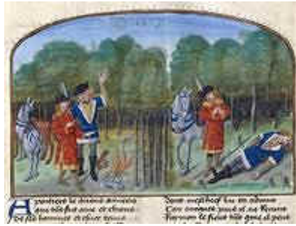
La chasse au sanglier, la mort du comte (Bibliothèque de France, Ms Fr 24 383, fol. 4)

Elle lui montre alors qu'elle est dotée de pouvoir divinatoire puisqu'elle est déjà au courant de ce qui vient de se passer et lui propose de l'épouser en lui promettant richesse et bonheur. La fée nous montre ici un de ses secrets : elle est toute puissante, mais pas au point de satisfaire, à l'instar d'une jeune fille, son désir d'épouser un chevalier. Pour cela, elle a besoin de le séduire et de lui imposer un interdit, pacte qui permet et protège leur amour tout à la fois.