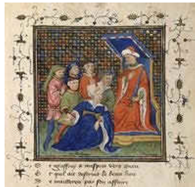
Les adieux de Mélusine et de Raymondin (Mélusine s'évanouit après avoir été insultée par son mari) Bibliothèque de France, ms Fr. 12575, fol. 79.

méfais de sa progéniture. Il révèle alors à tous la nature féerique de sa femme, et brise pour de bon l'interdit qui était alors devenue implicite. En effet, Mélusine n'avait pas fait promettre à Raymondin de ne jamais prononcer tel ou tel mot en sa présence ou de ne jamais l'insulter, Présine, par contre, l'avait précisé lorsqu'elle avait maudit sa fille : « si tu trouves un homme qui veuille t'épouser et promette de ne jamais te voir le samedi [...] ni de parler de cela à personne » 54 . Raymondin a donc brisé le pacte silencieux qui le liait à sa femme, Mélusine ne voulait pas vraiment cacher sa nature surnaturelle à l'homme qu'elle aimait, elle voulait qu'il l'accepte et qu'il garde le secret. En l'insultant de très fausse serpente, Raymondin commet deux fautes. Il dévoile tout d'abord, le secret de Mélusine à tous et la blesse profondément ensuite, puisqu'il montre ainsi qu'il n'accepte pas sa nature monstrueuse.