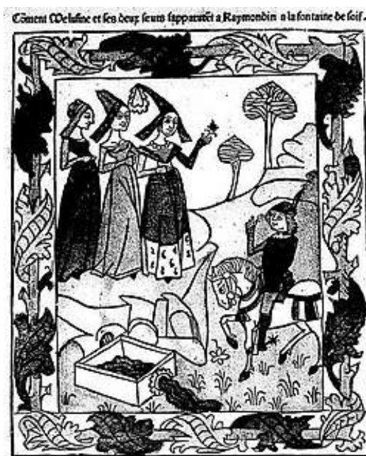
Rencontre de Raimondin et Mélusine

Pour replacer l'interdit dans le motif mélusinien, nous allons rappeler brièvement comment se passe la rencontre du mortel et de l'être surnaturel en se basant sur la structure donnée par L. Harf-Lancner dans Les fées du Moyen-Age . Le plus souvent l'homme et la fée se rencontrent dans une forêt ou près d'un point d'eau, alors que le héros est seul.