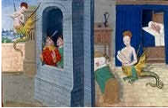
Mélusine berce son nouveau-né

(Bibliothèque de France, Ms Fr 24 383, fol. 30).