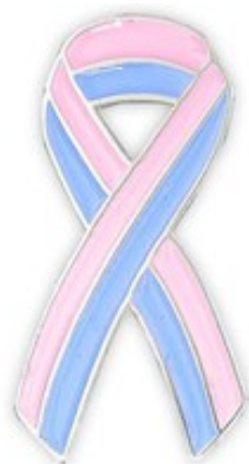
Illustration 8 : Ruban rose et bleu du deuil périnatal. Le 15 octobre, il est porté sur soi sous la forme d'un pin's ou affiché en tant que photo de profil sur Facebook.