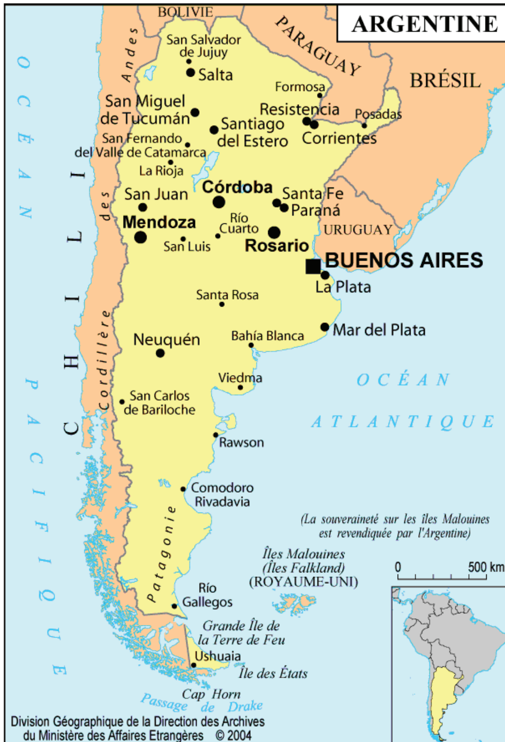
Annexe 1 : carte de l'Argentine.