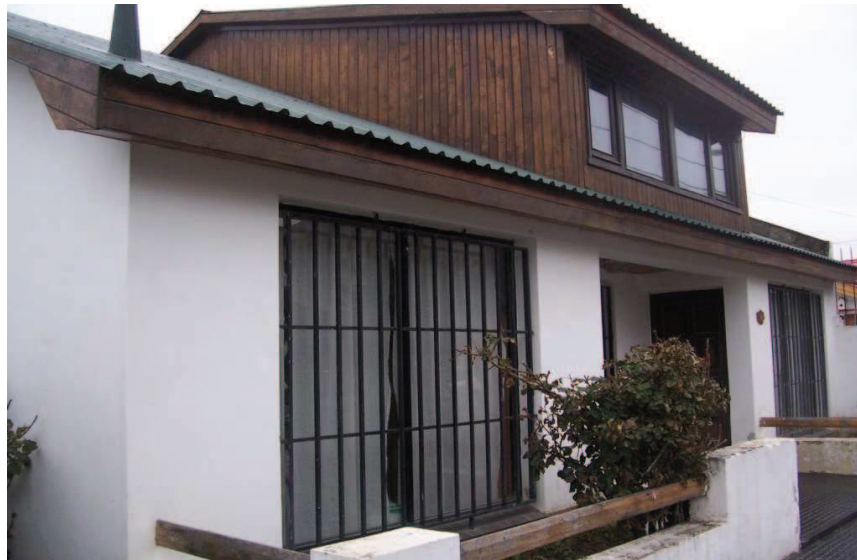
L'Alliance Française de Terre de Feu