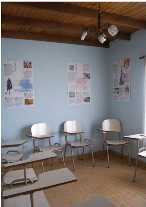
Une salle de classe