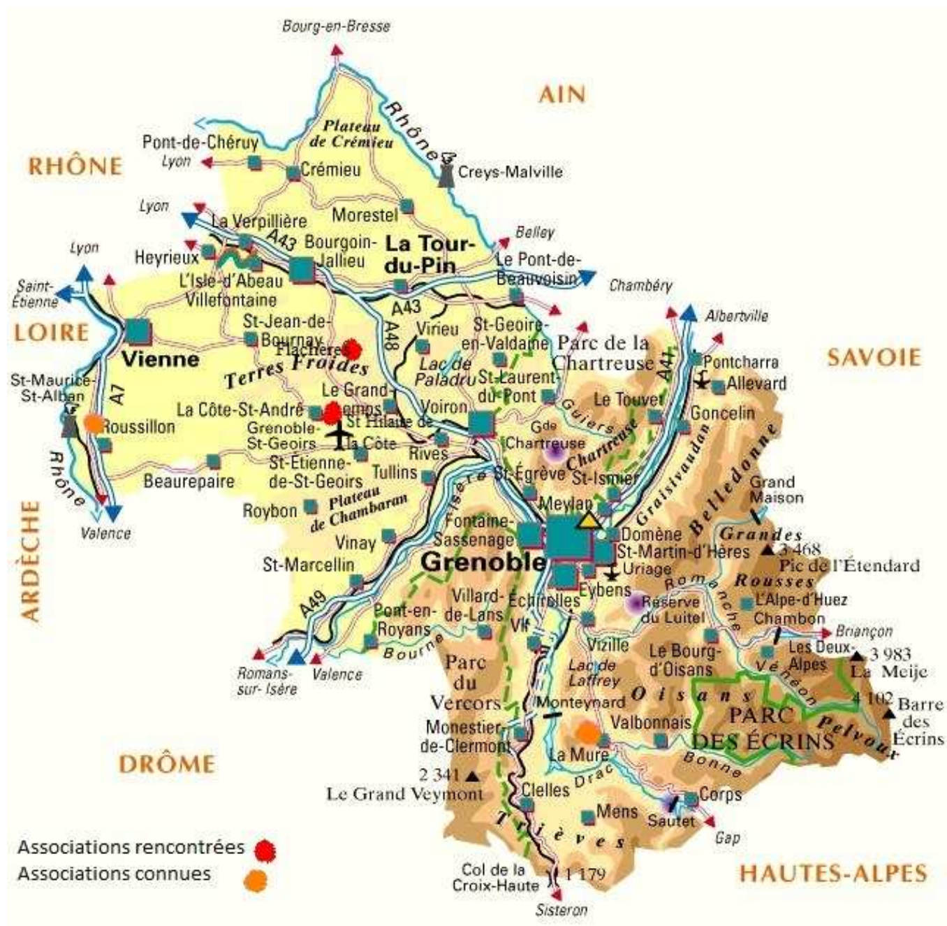
Figure : Localisation des associations dans le département de l'Isère

Ainsi, la situation géographique est primordiale quant à l'existence de ces associations et surtout quant à leur fonctionnement. Le réseau des Monts du Lyonnais a profité à l'AFPL alors que ce n'est pas le cas dans le département de l'Isère, bien que des liens existent entre le CPTF et les associations de Genas et Toussieu.