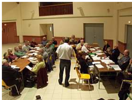
Figure : Réunion et programme pour le Conservatoire du Patois des Terres Froides 274