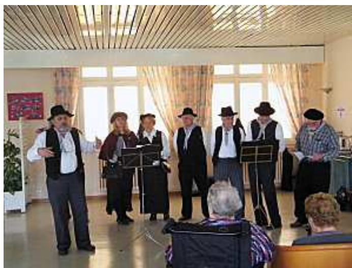
Figure : Les patoisants du CPTF à la maison de retraite 277

Une douzaine de patoisants sont allés mettre un peu d'ambiance à Roybon. Que certaines personnes âgées étaient heureuses, ont applaudi, ont même demandé : vous revenez quand ? Une après-midi bien sympathique que les résidents ont bien apprécié 275 . Quinze membres du conservatoire du patois des terres froides, sont allés mettre un peu de chaleur dans le cœur des résidents de la maison de retraite de Saint Chef. Certes, il n'y avait pas besoin de les réchauffer, vu le temps, mais c'était un vrai plaisir des yeux de les voir chanter en même temps que le groupe, rire devant les histoires drôles et applaudir à tout moment, tout simplement participer. La petite troupe déguisée a eu un peu chaud, mais s'est bien démenée en groupe ou individuellement 276 .