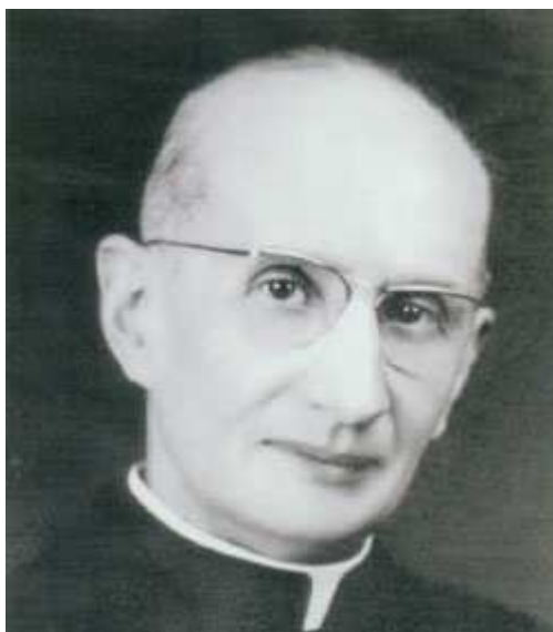
Figure : Monseigneur Pierre Gardette