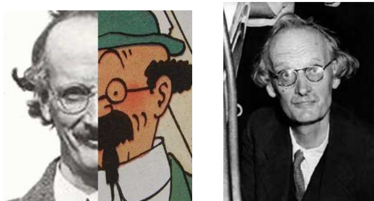
Figure : Tryphon Tournesol alias Auguste Piccard 200

Bien que peu reconnu, le francoprovençal, ou du moins ses acteurs, mettent en œuvre des projets pour le faire connaître au maximum en diversifiant ses formes et ses aspects. Maintenant que nous en avons dressé un portrait, permettant d'en savoir davantage et d'y voir un peu plus clair, voyons comment les langues régionales et surtout le francoprovençal se sont imposés dans les champs de l'historiographie et de l'histoire.