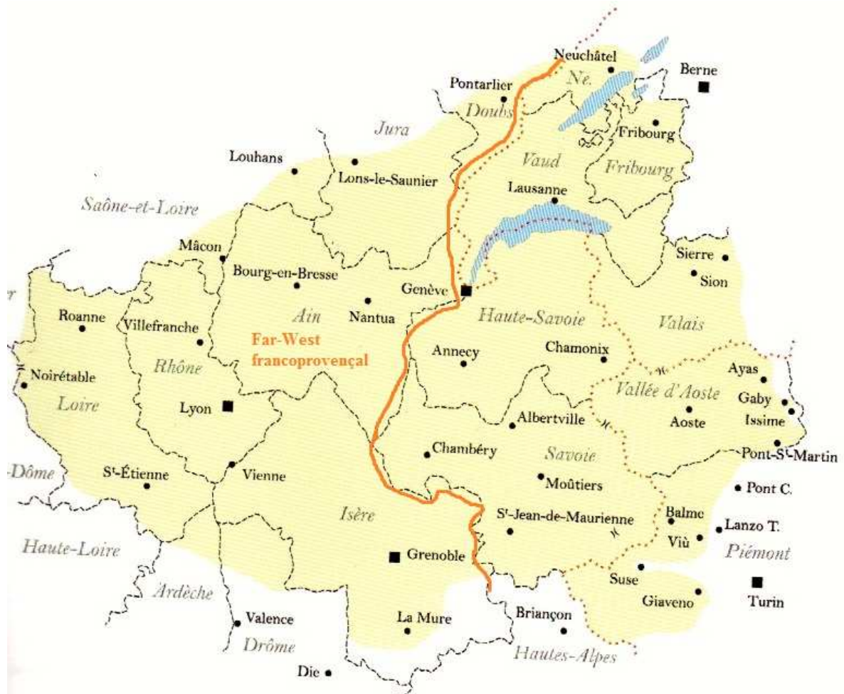
Figure : Carte « L'extension géographique et la délimitation du « Far-West » francoprovençal ».

partie intitulée « Connaître le francoprovençal » où nous présentons en détail cette langue régionale. Quant à la troisième partie intitulée « Vivre le francoprovençal », nous expliquerons ce qu'est cette langue aujourd'hui dans la zone ouest, ce que sont ses acteurs et son organisation.