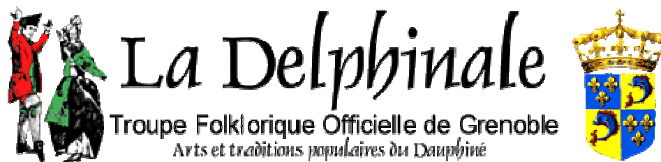
Figure : Emblèmes de la Delphinale 167

La Delphinale est un acteur de cette mémoire dauphinoise. Celle-ci est créée à l'occasion des Jeux olympiques d'hiver de Grenoble en 1968, « Événement typiquement isérois mais retentissement international 168 ». En 1965 quand le comité des Jeux olympiques a attribué à Grenoble le soin d'organiser les jeux de 1968, la ville ne possède pas de groupe folklorique pour représenter les arts et les traditions populaires du Dauphiné. Le maire Hubert Dubedout désigne des spécialistes pour se charger de cette affaire. Ainsi des recherches sont menées sur la période allant de 1830 à 1845 pour les costumes, car cette période est très riche. Quant à la danse, les recherches vont jusqu'à 1880. La documentation et la recherche aboutissent en 1966 à la naissance officielle de la Delphinale. Présente pendant les Jeux olympique, l'association perdure encore de nos jours. A travers les chants, la danse, les costumes, le théâtre elle s'emploie à faire découvrir le Dauphiné d'autrefois. Toutefois il est important de préciser que cette association n'embrasse pas le domaine des langues anciennes, hormis quelques bribes de texte au détour d'une chanson. Cette association est donc un acteur de premier plan pour la mémoire dauphinoise, mais une fois de plus cette mémoire n'est pas basée sur la langue.