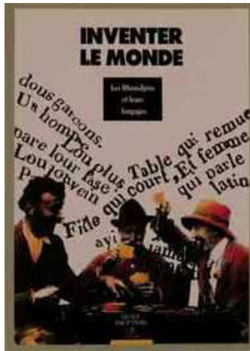
Figure : Couverture de l'ouvrage de l'exposition

Quand Gaston Tuillon écrit pour l'exposition, il estime à 2000 le nombre de Dauphinois qui sauraient encore parler francoprovençal et prévoit que dans les trente premières années du XXI e siècle la langue du Dauphiné s'éteindra. Pourtant cette exposition veut montrer par le prisme de la langue la vie quotidienne en Dauphiné, « ce qui ne frappe pas les regards, ce qui est humble, quotidien, discret 161 ». On ne peut donc pas parler d'un sentiment dauphinois, du moins d'un point de vue linguistique ; la langue est quelque chose de discret, comme on l'a dit.