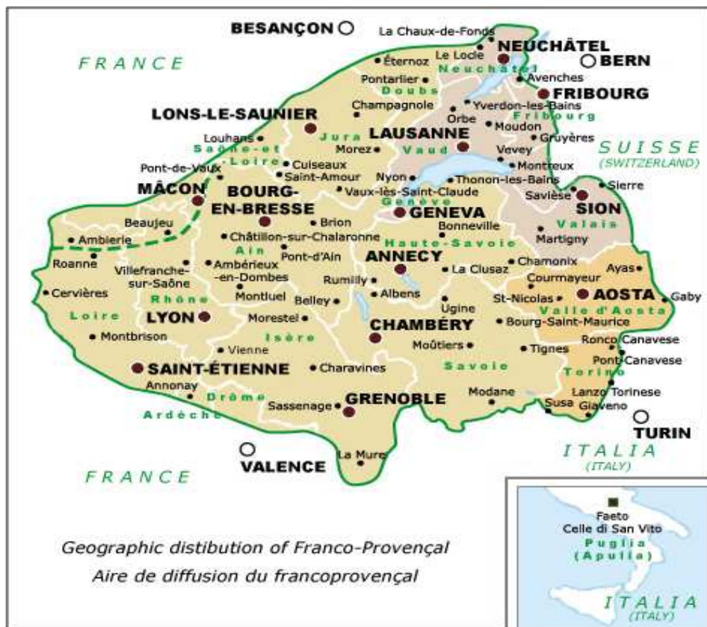
Figure : Carte de l'aire linguistique francoprovençale 187 .

français, ainsi que les villages de Faeto et Celle dans les Pouilles, province de Foggia, en Italie du Sud. Si l'extension autour de l'arc alpin est compréhensible au vu de ce qui a déjà été dit auparavant, il est nécessaire d'apporter pour les deux villages italiens des Pouilles quelques explications. On parle dans ces deux villages une variété de francoprovençal depuis environ sept siècles. Deux hypothèses existent quant à cette enclave linguistique. La plus courante veut que cette implantation soit le résultat de la sédentarisation au XIIIe siècle de soldats originaires du Dauphiné, envoyés par Charles Ier d'Anjou pour combattre les mercenaires musulmans. La deuxième piste est plus pertinente. Vers 1400, à la suite de la rigueur de l'Inquisition sévissant en Dauphiné, les Vaudois qui se sont enfuis dans les hautes vallées du Piémont, fondent de nouvelles colonies dans de petites villes des Pouilles donc Faeto.