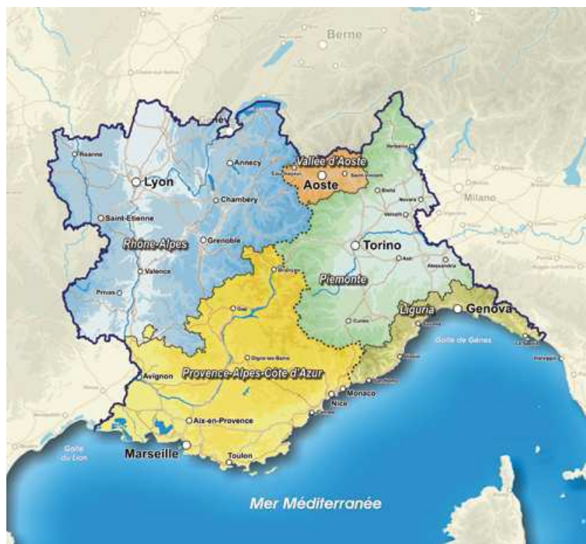
Figure : Carte de l'Eurorégion Alpes Méditerranée.

D'un point de vue plus personnel et dans le cadre d'une éventuelle recherche future, l'étude du francoprovençal pourrait s'insérer dans une recherche à l'échelle européenne. Le thème des langues régionales mit en perspective avec les Eurorégions, permet de s'intéresser aux politiques linguistiques à l'échelle de l'Union européenne. L'Eurorégion est une structure administrative de coopération transfrontalière entre deux ou plusieurs territoires de différents États européens. Elles ont pour but de promouvoir les intérêts communs transfrontaliers. Par exemple, l'Eurorégion Pyrénées-Méditerranée comprend la Catalogne, l'Aragon, les îles Baléares, les Régions Midi-Pyrénées et Languedoc-Roussillon, ainsi s'ajoute au français et à l'espagnol, le catalan et l'occitan comme langue de communication et de travail. L'Eurorégion Alpes Méditerranée regroupe la région Rhône-Alpes, la région Provence Alpes Cote d'Azur, le Val d'Aoste, le Piémont et la Ligurie. Cette zone est donc concernée par le francoprovençal qui est parlé de part et d'autre de la frontière entre la France et l'Italie.