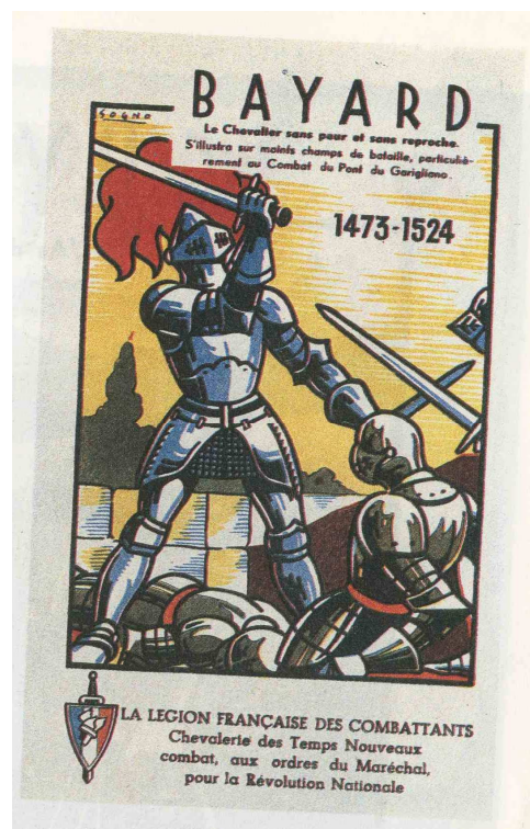
Figure : Buvard d'écolier – Musée des Deux Guerres mondiales 62

Le 24 décembre 1941, un arrêté ministériel donne le droit et la possibilité aux instituteurs de dispenser des cours de patois, à raison d'une heure et demie par semaine. Pour reprendre les expressions de Christian Faure 61 , la France de Vichy instaure « une légende des siècles » bâtie sur les héros choisis du Panthéon traditionnel français, mais encore sur les figures régionales, « les héros des petites patries ». Pour prendre une figure locale, ce buvard d'écolier illustre bien cette volonté de glorifier les héros locaux.