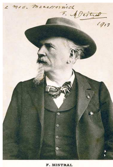
Figure : Frédéric Mistral 213

premier poème, Mireio , Mireille en provençal ; sa vie aurait du rester celle de l'ermite de Maillane, mais son succès en fait une image reconnue du monde littéraire et de la Provence. Il reçoit en 1904 le Prix Nobel de littérature et dans la foulée se consacre à la création du Museon Arlaten , en provençal Musée d'Arles. On y trouve les collections d'objets, de costumes et d'histoires locales que le Félibrige s'est employé à réaliser. Ce musée est « destiné à conserver, raviver et perpétuer la vie et la culture provençales, menacées par la modernité en général et par la machine centralisatrice infernale du nouveau régime républicain 210 ». La cause provençale, ce « félibréisme » prend inévitablement un tournant politique dans sa protestation contre l'uniformisation que connaît la France, contre « l'empire nordique 211 ». Les félibres veulent réveiller la conscience provençale, éveiller le patriotisme local par la littérature, ainsi s'opère un certain fédéralisme des provinces méridionales 212 . Cependant, Frédéric Mistral reste avant tout un poète et un contemplateur de la Provence, plus qu'un militant.