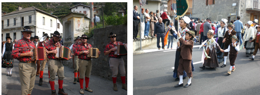
Figure : Groupes lors du défilé pour le Rassemblement à Carema en 2008.

francoprovençal », ainsi qu'une présentation des nouveautés éditoriales 321 . En 2009, l'Association des Enseignants de Savoyard/francoprovençal (AES) anime également un colloque. En 2010, c'est cette fois une table ronde sur le thème « langue et identité 322 ». De manière générale à la fin d'après midi, on favorise le mélange des groupes autour de marchés de produits locaux et d'animations comme des ateliers de métiers anciens par exemple. Tous les groupes se retrouvent ensuite pour un repas commun, où tous se mélangent et interviennent, prolongeant la soirée par une veillée, un spectacle ou un bal populaire. Le dimanche matin, une messe en patois est célébrée, suivie d'un défilé en costumes de tous les groupes.