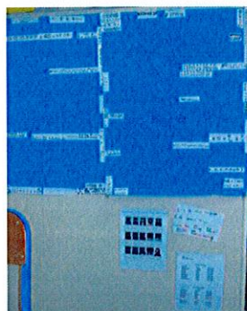
Coin correspondance de la classe