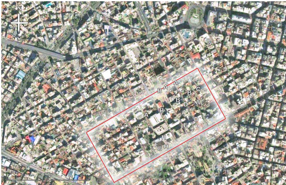
Carte 5. Localisation des commerces ethniques : A épicerie, B restaurants, C agence de voyage, D imprimeries, E salon de coiffure, F cabinet médical, H cabinets d'avocat, G le bâtiment dit Chinatown .

Ces commerces jouent un rôle particulier dans la structuration communautaire et la formation d'un « territoire chinois ». Comme le souligne Anne Raulin, « l'aspect ethnique dans le commercial » doit être interprété comme une affirmation de l'identité collective du groupe 88 .