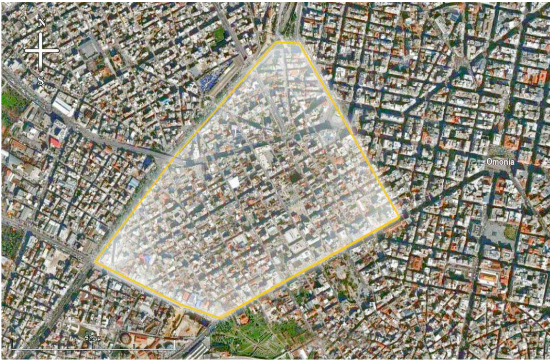
Carte 3. Le quartier de Metaxourgio dans la Municipalité d'Athènes.