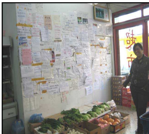
Image 6. Vie quotidienne à l'intérieur d'un petit supermarché

De plus, dans le quartier nous trouvons quatre petits supermarchés ou épiceries (Image 6). Notons que les supermarchés ont aussi un rôle important pour la circulation des informations puisqu'ils sont fréquentés par tous les membres de la communauté. Ce sont aussi les lieux par excellence où les nouveaux venus s'adressent pour trouver un emploi. Tous les mardis et samedis, un marché des fruits et de légumes chinois se déroule dans la rue Agisilaou.