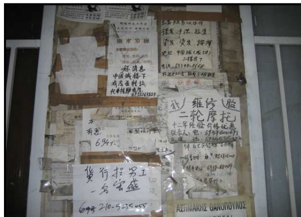
Image 10. Petites annonces.