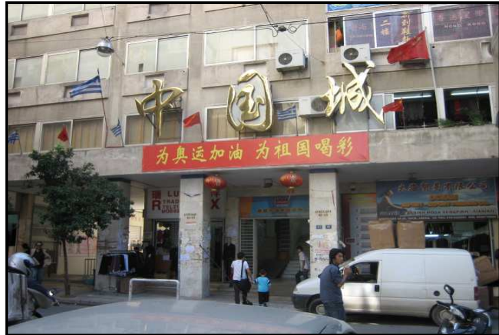
Image 11. Le bâtiment emblématique du N. 43 de la rue Agisilaou.

Ce bâtiment multifonctionnel est devenu le point de référence du quartier dans son ensemble. Il prend une forte valeur symbolique en représentant la prospérité économique de la communauté. Les idéogrammes chinois sur sa façade attestent le nom du bâtiment : Chinatown (Image 11).