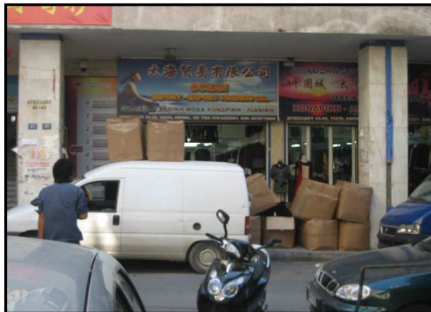
Image 9. Occupation du trottoir.

Un autre mode d'appropriation est celui qu'on rencontre sur l'espace public (Image 9) et à travers les pratiques quotidiennes des migrants : petites annonces pour la vente ou la location d'appartements (Image 10), noms chinois sur les entrées des immeubles, publicités sur toutes les marchandises qui circulent d'un magasin à l'autre ou entre lieux de stockages et divers étalages, etc.