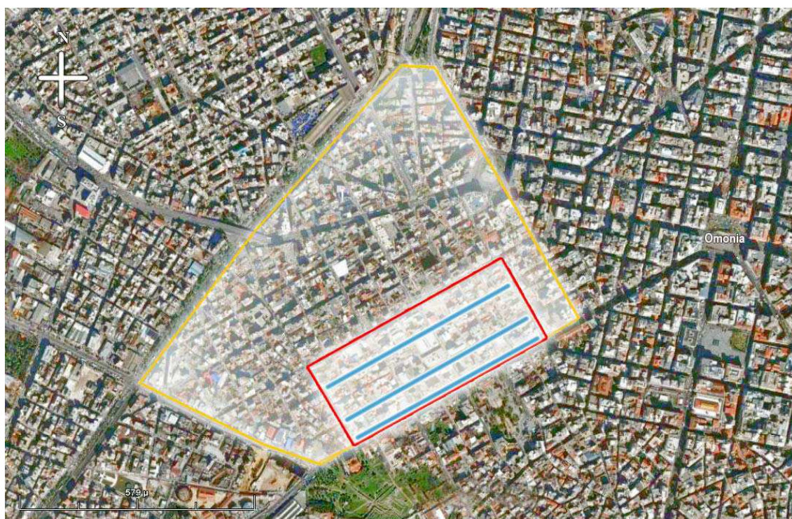
Carte 4. Le « quartier chinois » d'Athènes, dans le quartier de Metaxourgio. Limites et les trois rues commerciales représentatives.

Ses limites sont: la rue Leonidou au nord-ouest, la rue Kolonou au nord-est, la rue Piréos au sud et la rue Plataion au sud-est. Un nombre particulièrement important des commerces chinois, comme nous allons le voir, se localisent dans trois rues principales du quartier : les rues Agisilaou, Keramikou et Piréos (Carte 4).