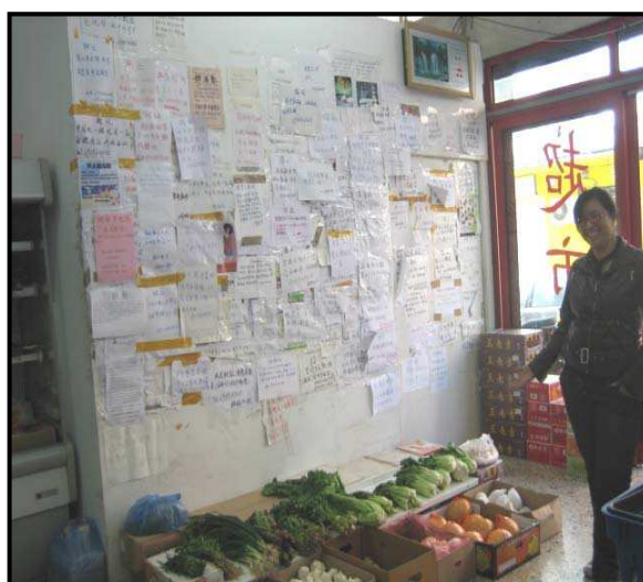
Image 6. Vie quotidienne à l'intérieur d'un petit supermarché

De plus, dans le quartier nous trouvons quatre petits supermarchés ou épiceries (Image 6). Notons que les supermarchés ont aussi un rôle important pour la circulation des informations puisqu'ils sont fréquentés par tous les membres de la communauté. Ce sont aussi les lieux par excellence où les nouveaux venus s'adressent pour trouver un emploi. Tous les mardis et samedis, un marché des fruits et de légumes chinois se déroule dans la rue Agisilaou.