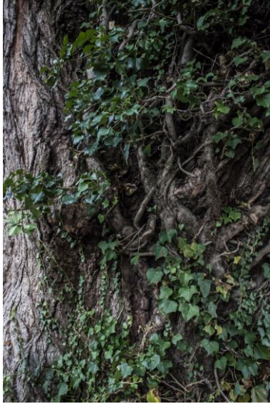
- Détail du lierre du « frêne de Saint-Martin-d'Hères ». Photo par Eric Montredon (2012).