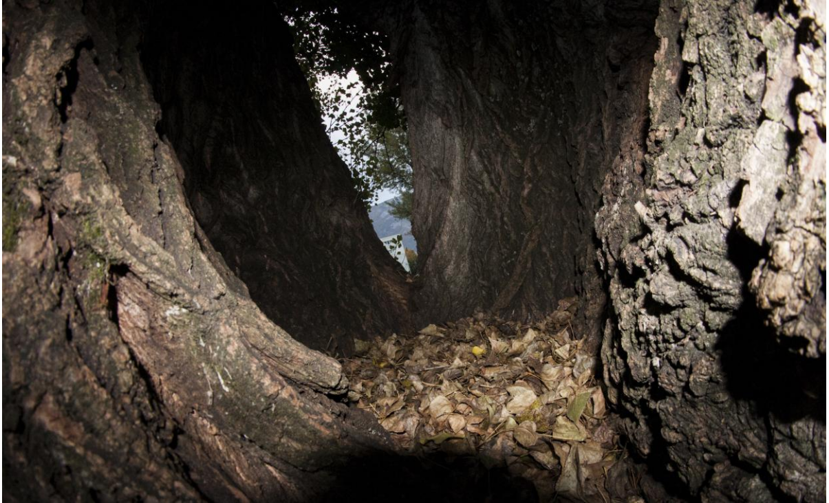
- Intérieur du creux du « frêne de Saint-Martin-d'Hères », dans lequel on peut mettre une personne ou un enfant. Photo par Eric Montredon (2012).