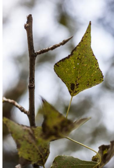
- Détail du « frêne de Saint-Martin-d'Hères ».

- Commentaire : notez la forme en pointe de lance des feuilles.