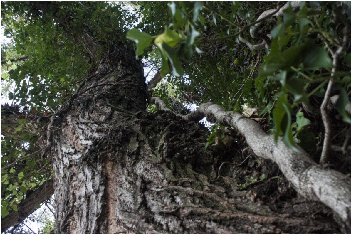
- Détail du lierre grimpant sur le « frêne de Saint-Martin-d'Hères ». Photo par Eric Montredon (2012).

- Commentaire : « Les plus anciennes lianes de lierre ressemblent au serpent... » (Pennick, op. cit. ).