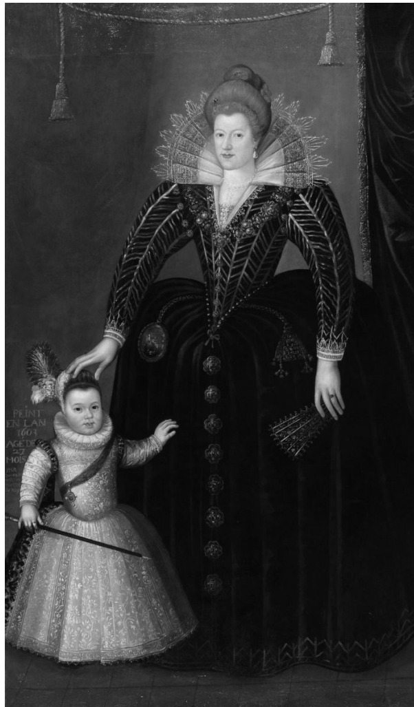
Fig. 2. Marie de Médicis et le dauphin Louis . Charles Martin, 1603, huile sur toile, Blois, musée des Beaux-Arts du château.

Après la naissance du dauphin en 1601, Marie de Médicis abandonne le costume à l'italienne pour se vêtir à la française comme l'atteste, entre autres, une dépêche de Giovannini du 8 novembre 1601 46 . Dès lors, on constate ces changements vestimentaires dans les portraits de la reine. Elle porte des robes à la taille surbaissée et soutenues par des vertugadins à la forme cylindrique. Le corsage est très long et les manches généralement gonflées et volumineuses. Les collerettes sont beaucoup plus légères et servent plutôt d'écrin à la coiffure 47 . Elles se prolongent avec d'amples décolletés en carré. Le tableau de Pourbus en donne d'ailleurs une illustration parfaite. Il n'est pas anodin que son changement de costume intervienne immédiatement après qu'elle ait mis au monde l'héritier de la couronne de France. Il va de pair avec la « naturalisation » qu'elle vient de mériter. Elle doit dorénavant apparaître comme étant complètement française.