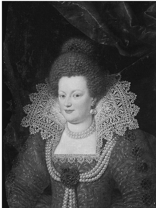
Fig. 3. Portrait de Marie de Médicis, épouse d'Henri IV de France, Frans Pourbus le Jeune, 1606, huile sur panneau, Florence, Galerie Palatine, palais Pitti.

savoirs renforcent l'emprise sur les hommes qu'il gouverne ». Ainsi, « l'accumulation de trésors [...] participe d'une conception du pouvoir fortement inspirée par les écrits hermétiques et par les convictions néo-platoniciennes répandues depuis la fin du XV e siècle par Marsile Ficin ou Pic de La Mirandole » 51 . Le goût de Marie pour les pierreries est donc fortement influencé par toutes ces convictions qui accordent aux pierres précieuses des valeurs symboliques voire religieuse, en plus de leurs valeurs marchandes ou esthétiques.