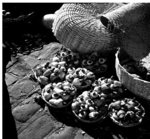
Illustration 9: Cajou ou acajou (Anacardium occidentale L.), originaire d'Amérique, communément consommé par les indigènes