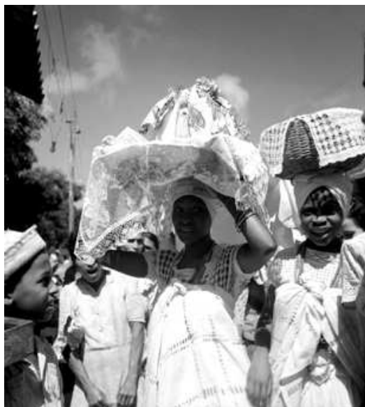
Illustration 1: Bahianaises avec leur plateau - Pierre Fatumbi Verger