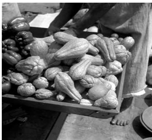
Illustration 10: Chuchu (Sechium edule), originaire d'Amérique