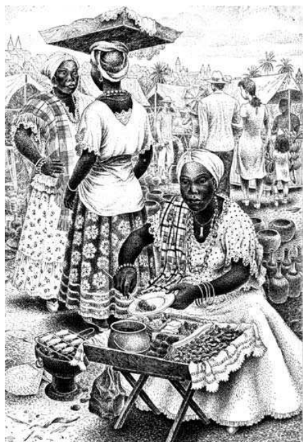
Illustration 3: Baiana de acarajé - Percy Lau