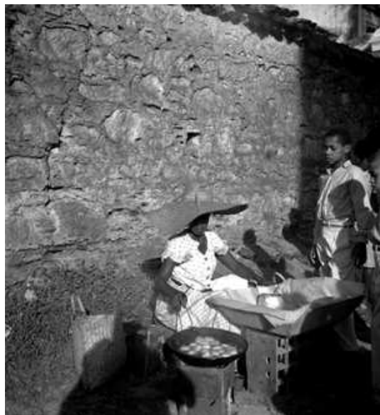
Illustration 2: bahianaise cuisant ses acarajés au coin d'une rue - Pierre Fatumbi Verger