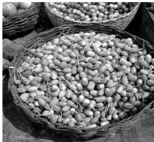
Illustration 6: Maxixe (Cucumis anguria L.), originaire d'Afrique