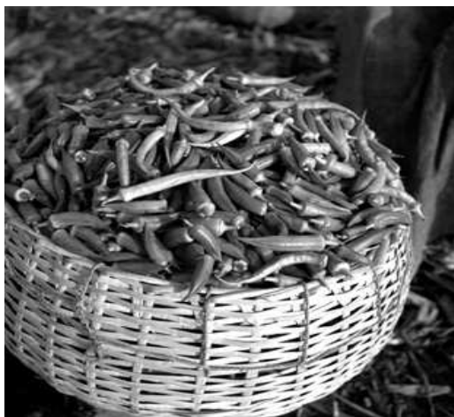
Illustration 5: Gombos (Abelmoschus esculentus), originaire d'Afrique