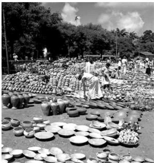
Illustration 11: Ustensiles bahianais traditionnels en terre