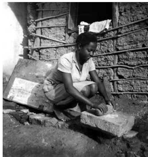
Illustration 12: Pierre à râper, instrument originaire d'Afrique, et qui fut longtemps central dans le système alimentaire bahianais, avant l'introduction des broyeurs et mixeurs électriques