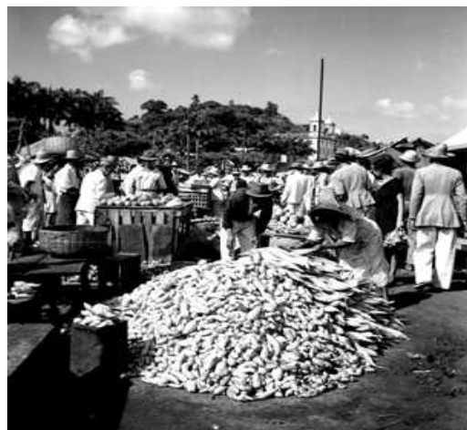
Illustration 8: Maïs (Zea mays) d'origine américaine