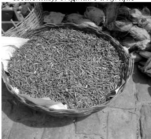
Illustration 7: Piments de malaguette, originaire d'Amérique, et Noix de coco, originaire de l'Asie, mais l'usage de ces plantes a été diffusé par les esclaves africains