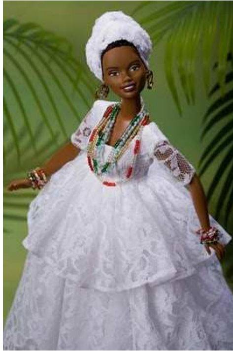
Illustration 13: Barbie bahianaise