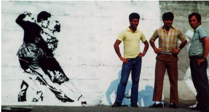
Blek le rat, Last tango in Paris , 1986.

- Le pochoir : de la famille des graffitis, le pochoir permet de reproduire le même dessin en plusieurs exemplaires. Il arrive à Paris au début des années 1980, Blek le rat étant l'initiateur du mouvement en France. Textes, portraits, paysages, il peut tout représenter. D'abord peint directement sur les murs, il est de plus en plus fréquemment effectué sur des affiches ensuite collées (suite à de lourdes peines pour dégradation de biens publics). Le pochoir, plus qu'une technique de reproduction, donne également une esthétique bien particulière.