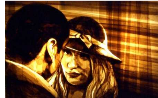
Max Zorn, Once at night

Adhésif de couleur ou non, images à l'échelle ou non, cette technique est maintenant utilisée par plusieurs artistes dans le monde entier. Le plus fin dans la réalisation est à mon sens Max Zorn, qui n'utilise que du scotch marron de déménagement, et parvient par succession de couches (contrairement aux autres qui ne superposent jamais le scotch) à créer des visages d'une expressivité incroyable. Il dispose ensuite ses petites œuvres sur des lampadaires ou autres sources lumineuses urbaines pour créer ces images du quotidien.