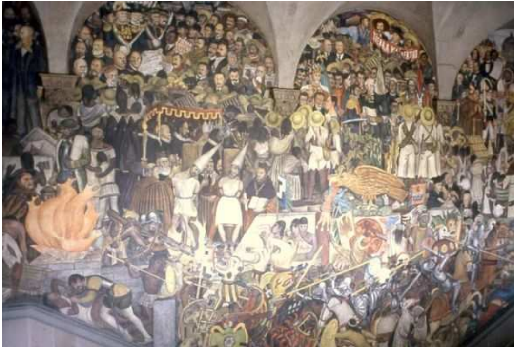
Diego Rivera, Fresque représentant l'histoire du Mexique, Palais National de Mexico.

perception habituelle, et c'est pour tous un rêve éveillé» 1 . Cette Forêt suspendue réalisée par Lucie-Lom en 2004 est un bel exemple. Une forêt où les arbres sont à l'envers dépend du domaine de l'imaginaire. Les passants ne peuvent être que surpris par cette image impossible, irréaliste, et pourtant bien devant leurs yeux. Le but de l'installation réside bien là : surprendre le passant, mais en immisçant l'imaginaire, l'impossible, dans la réalité. Ce n'est plus simplement le divertir, le faire sourire par un élément sortant du quotidien, mais véritablement l'intriguer, le questionner, le faire croire à l'impossible.