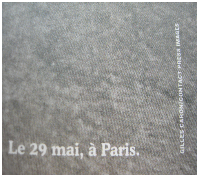
Numéro spécial Télérama : Mai 68 l'Héritage (avril).