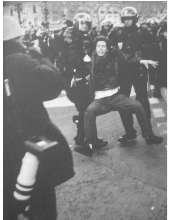
Le président Sarkozy et un jeune arrêté lors des manifestations anti CPE en 2006 (Numéro spécial de Télérama , Mai 68 l'Héritage, avril).