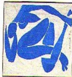
Le bleu II, 1952