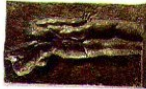
La femme au chapeau, 1905