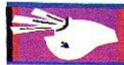
Le blanc de la tête, 1943