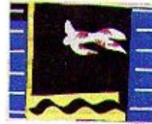
Le plaisir de la couleur I, 1943