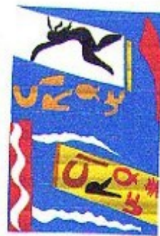
Le cirque, 1943