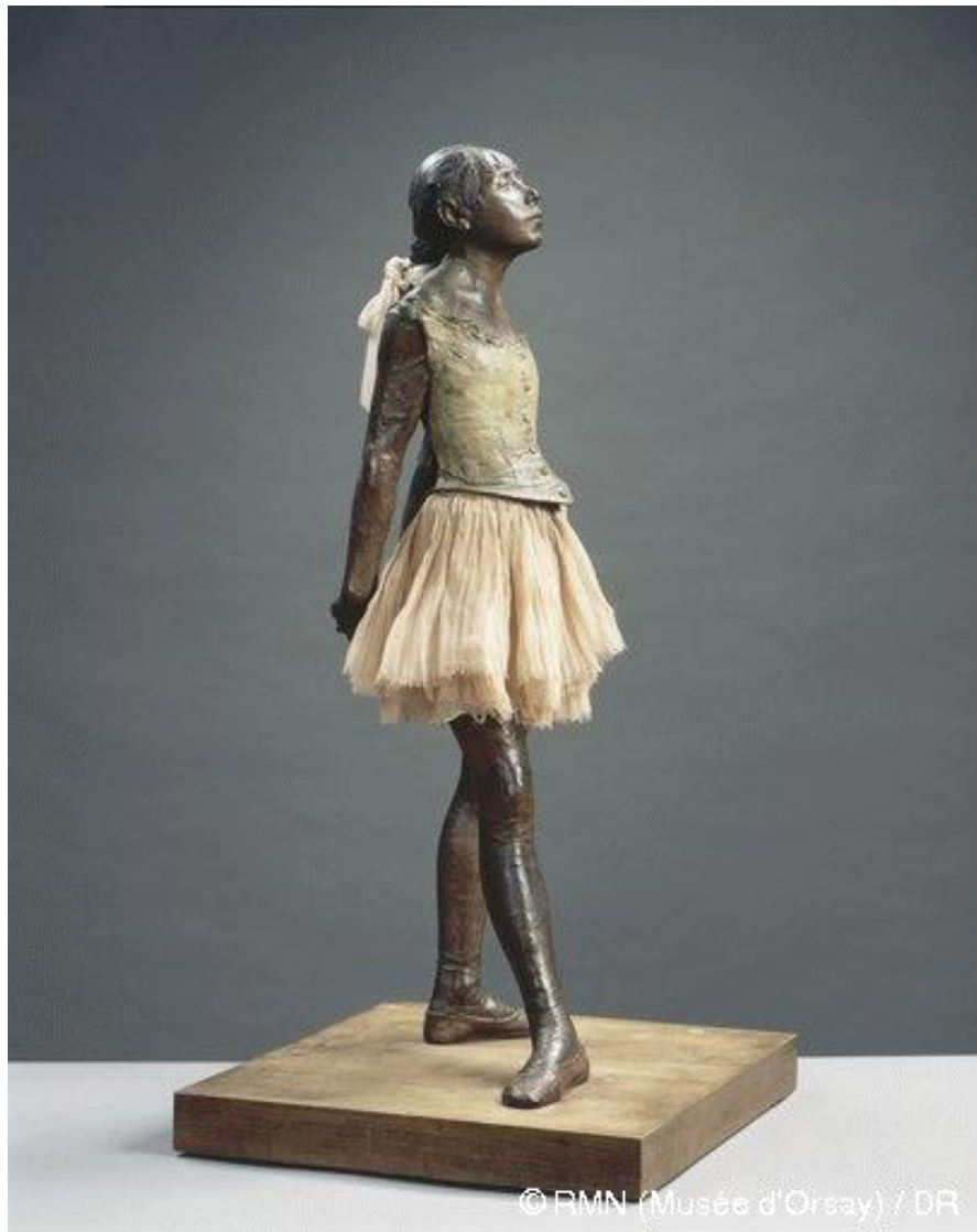
Degas – bronze – 90 cm x 35,2 cm x 24,5 cm – Musée d'Orsay, Paris – entre 1921 et 1931 – modèle entre 1865 et 1881 1 .