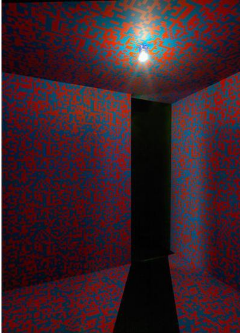
François Morellet – papier mural sérigraphié, ampoule électrique, réinstallation 2011 – Centre Pompidou, Paris – 1963 6 .