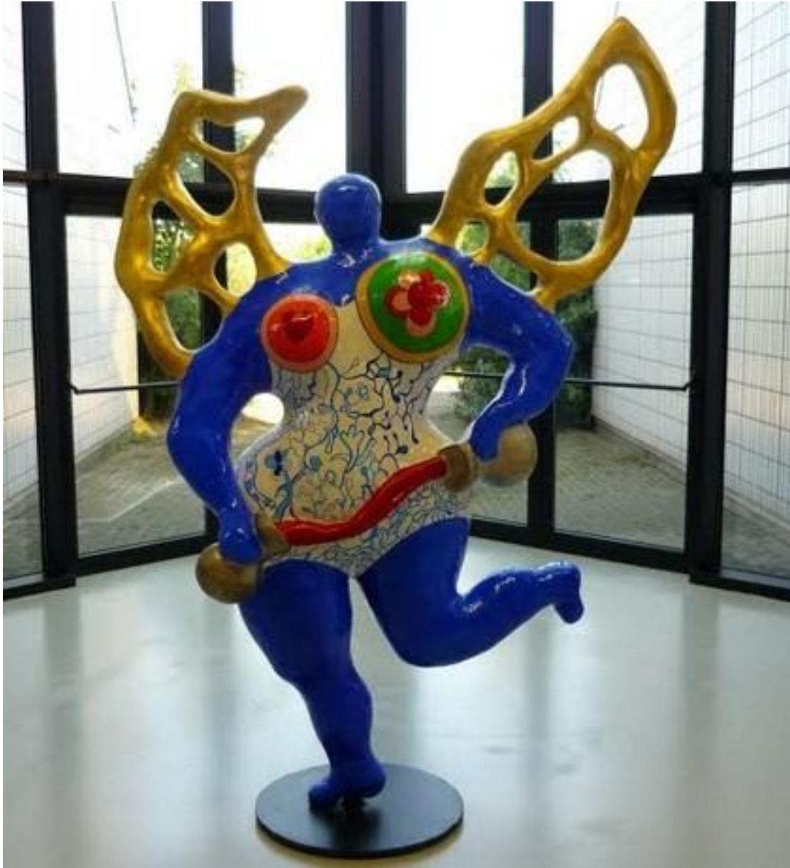
Niki de Saint Phalle – résine polyester – 240 cm – Galerie Bonnier, Genève – 1983-1984 8 .