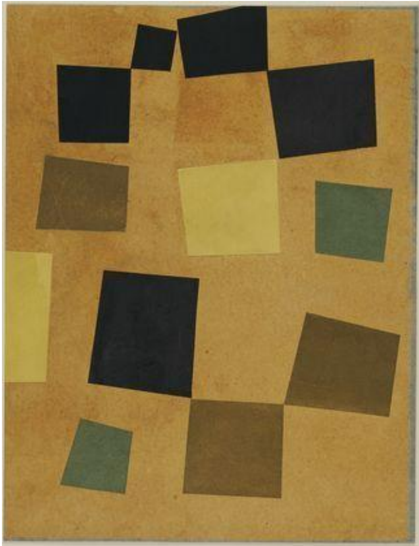
Hans Arp – collage de papiers colorés sur carton – 33,2 cm x 25,9 cm – Museum of Modern Art, New York – 1916 5 .