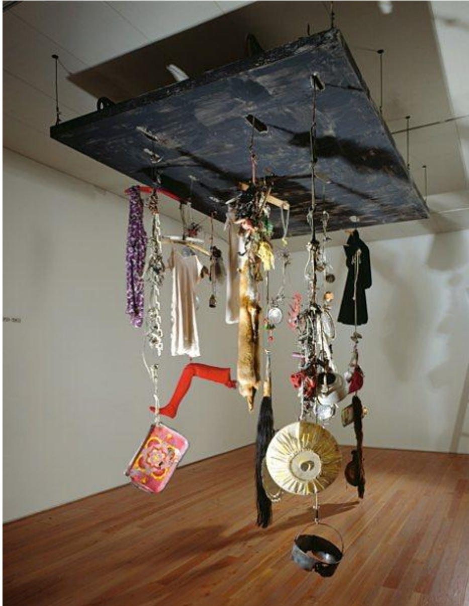
Tinguely – assemblage – 400 cm x 350 cm x 220 cm – Musée Tinguely, Bâle – 1961 4 .