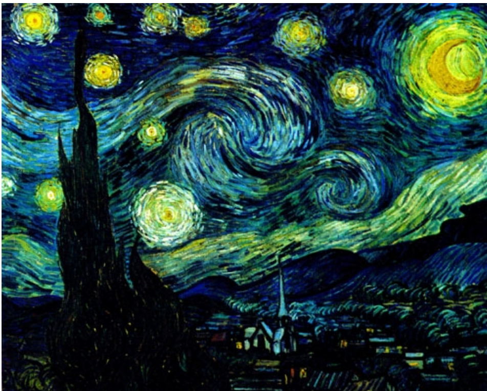
Vincent Van Gogh, Nuit étoilée (1889)