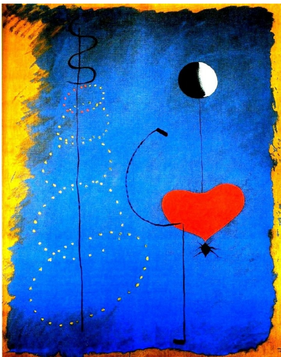
Joan Miro, Danseuse II (1925)