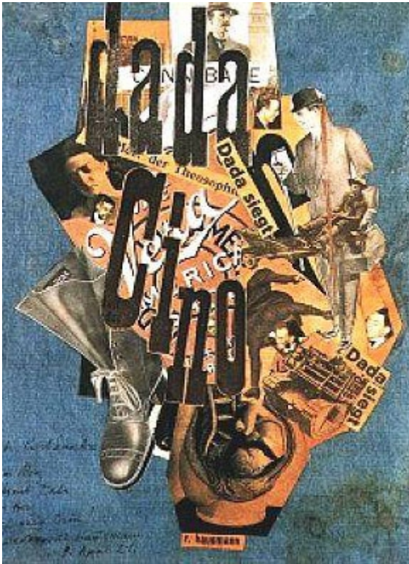
Raoul Hausmann, Dada-cino (1920, collage)