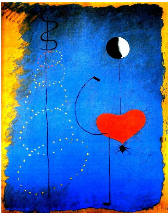
Joan Miro, Danseuse II (1925)