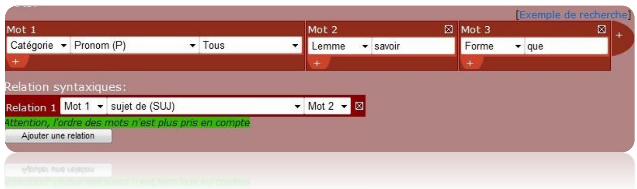
Figure 4 : Requête libre dans Scientext

Il est possible de paramétrer le nombre de résultats voulus, nous avons indiqué une limite à 5000 occurrences afin d'obtenir des informations assez