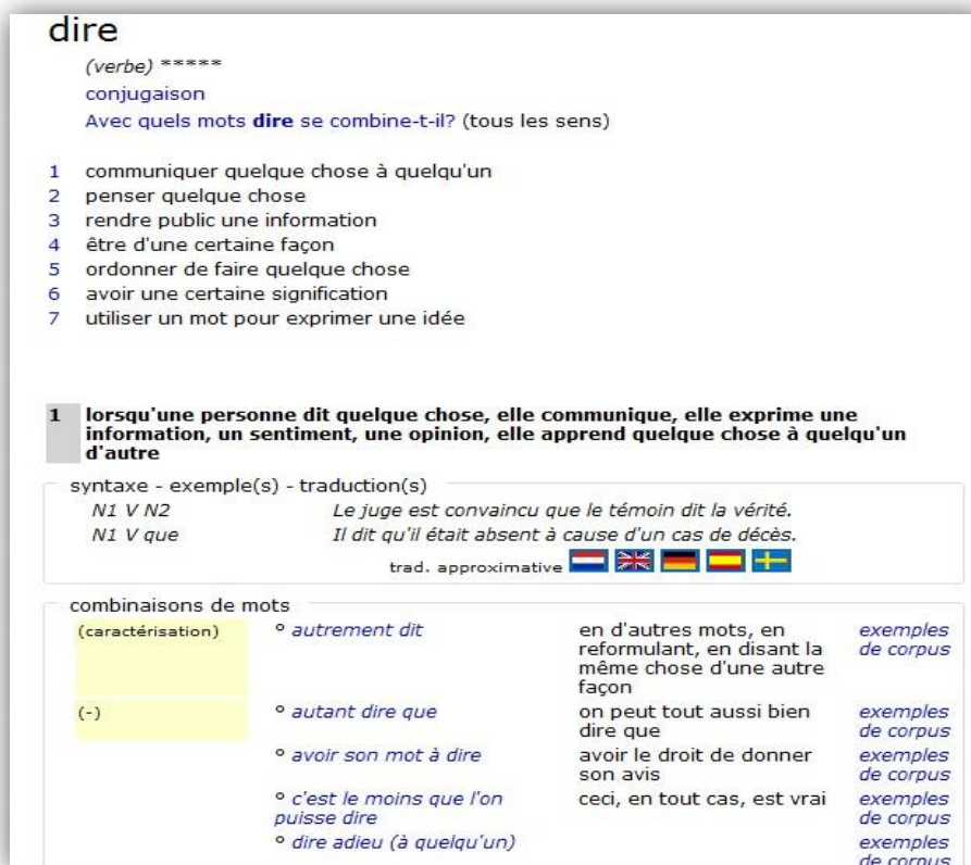
Figure 2 : Extrait de l'article du verbe DIRE sur le DAFLES

Par exemple, dans l'extrait ci-dessus, nous avons des combinaisons de mots intéressants liés au premier sens du verbe dire telles que autrement dit , autant dire que , avoir son mot à dire , etc. Ce plan est suivi par l'ensemble des articles.