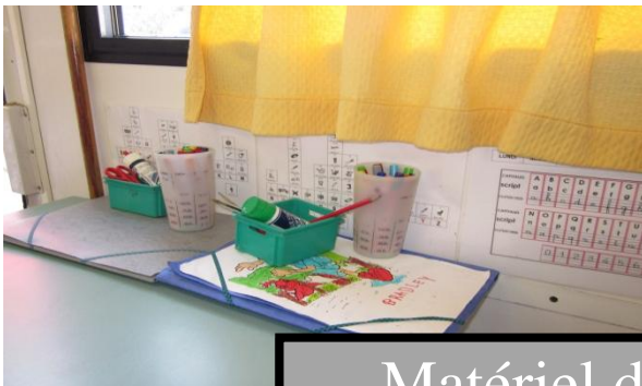
Matériel des élèves