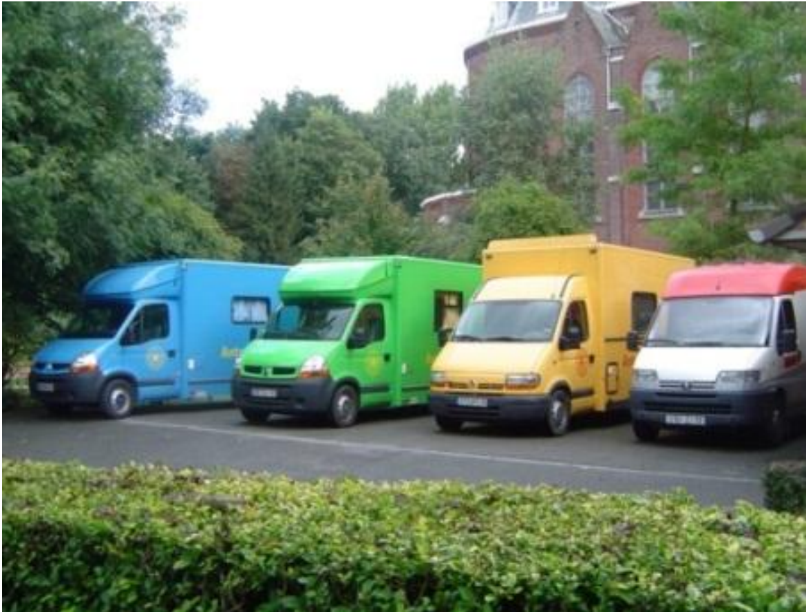
De gauche à droite : classe collège ; classe primaire ; classe maternelle et bibliothèque du voyage de l'ASET.