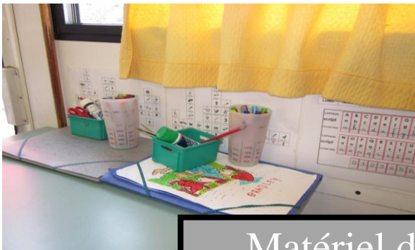
Matériel des élèves