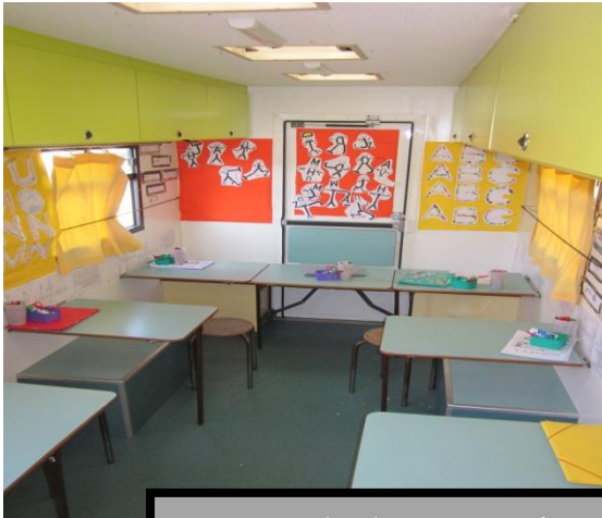
Fond du camion