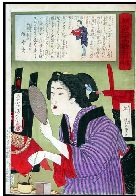
Tsukioka Yoshitoshi (1839-1892)