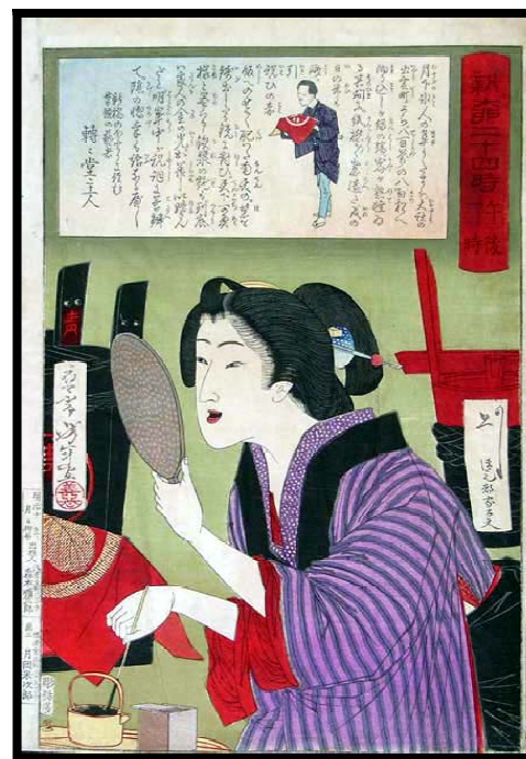
Tsukioka Yoshitoshi (1839-1892)