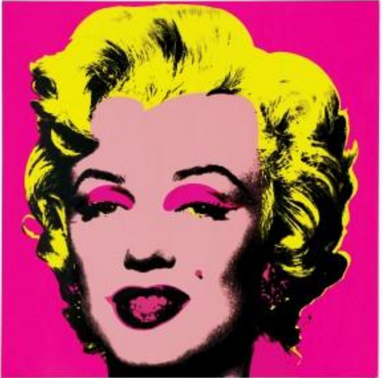
Marilyn, Andy Warhol, 1963