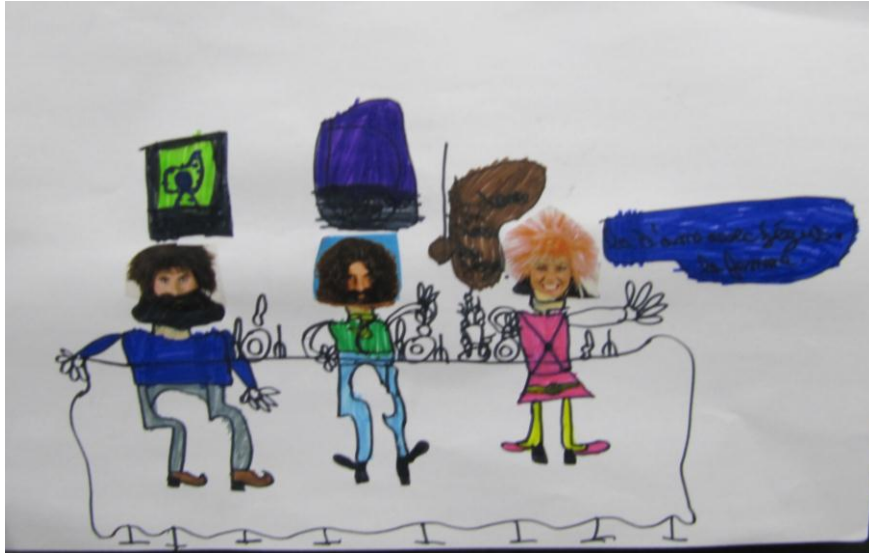
Dessin d'un élève de CE1-CE2, assimilation au tableau de Léonard De Vinci