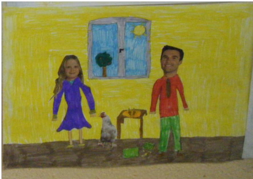
Dessin d'un élève de CE2-CM1, assimilation au tableau de Léonard De Vinci