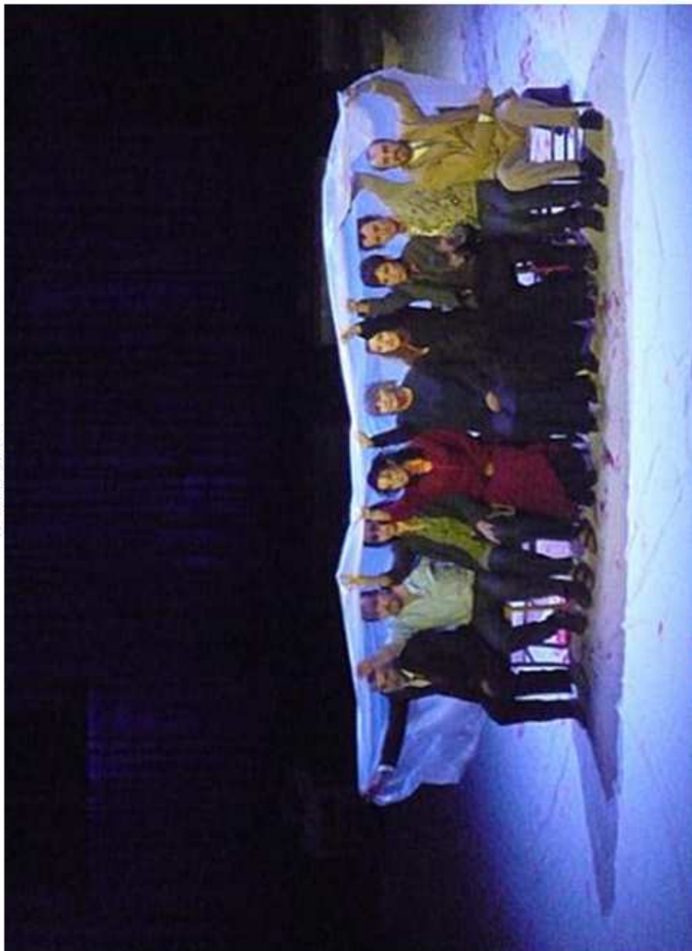
Scène finale de Incerndies : pluie sur tous les personnages.