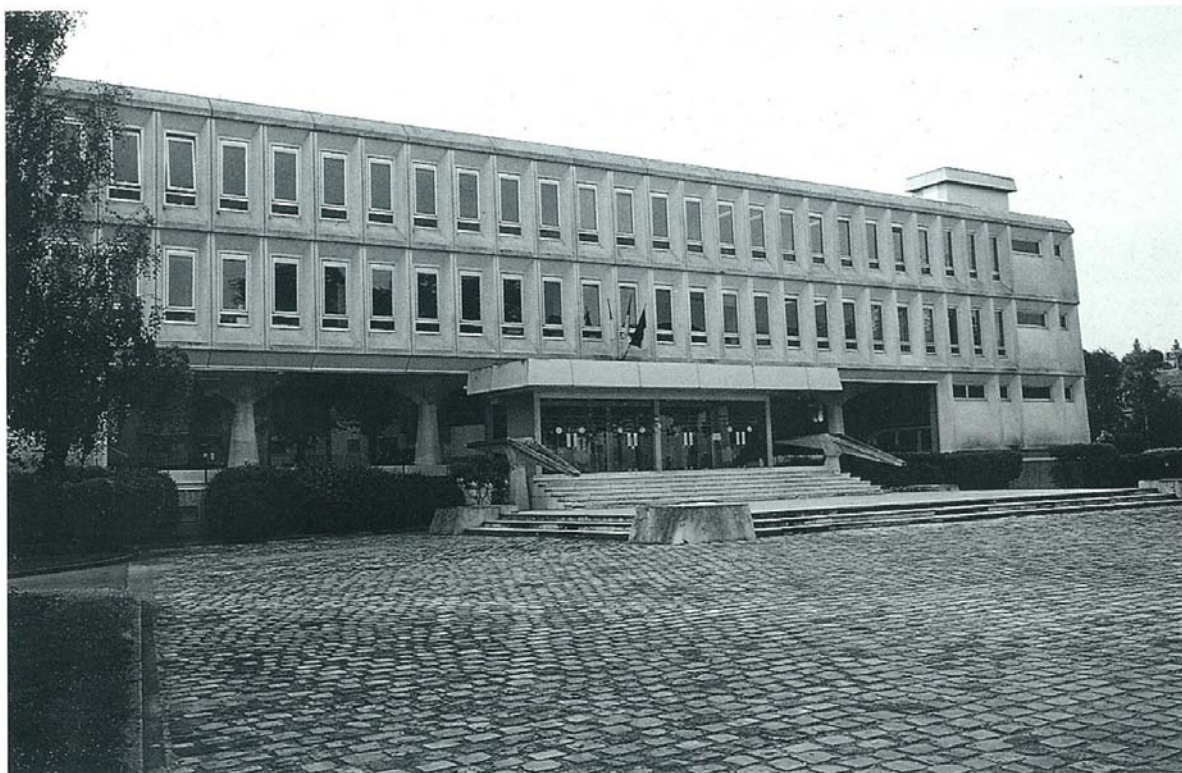
Beauvais - Palais de justice moderne