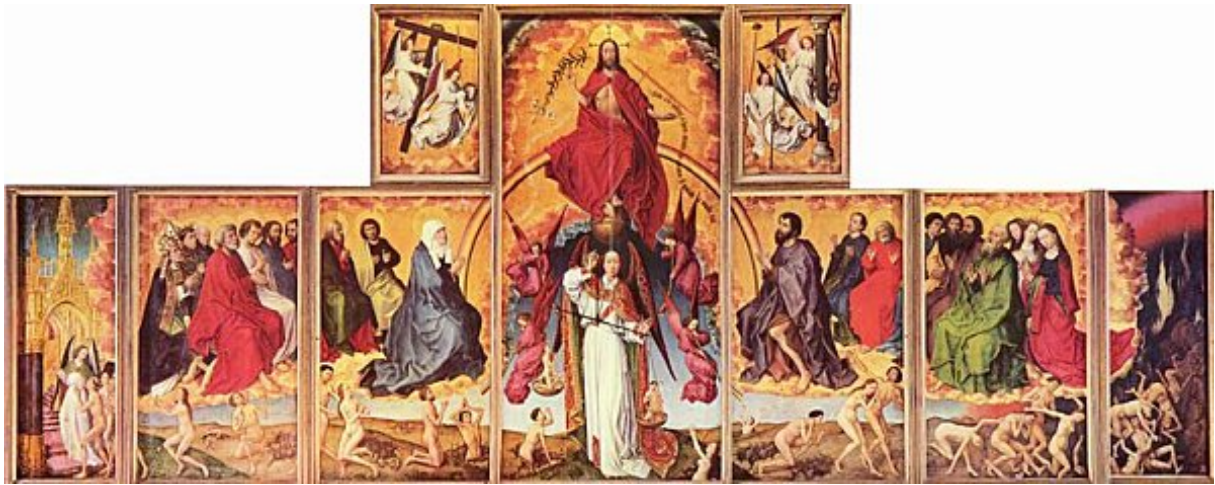
Le jugement dernier - Roger Van der Weyden