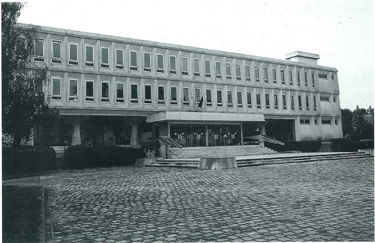
Beauvais - Palais de justice moderne