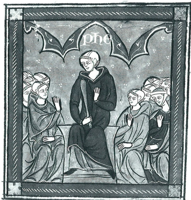
66. Le jugement. (Philippe de Beaumanoir, Contumes de Clermont-en-Beauvaisis , Staatsbibliothek Berlin, ms. Hamilton 193, fol. 212, fin du XIII e - début du XIV e s.)