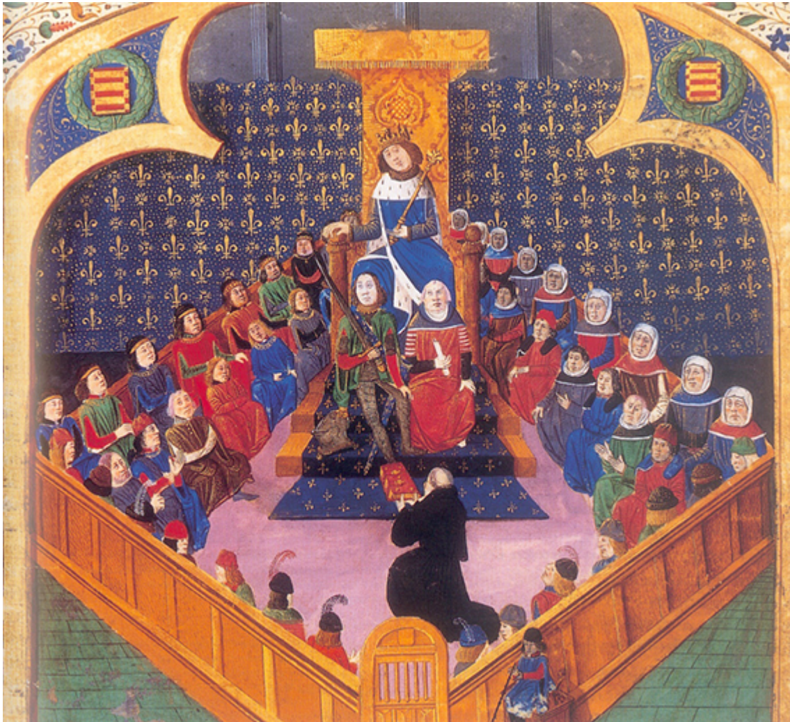
Séance du Parlement de Paris présidée par le roi au 14 ème siècle.