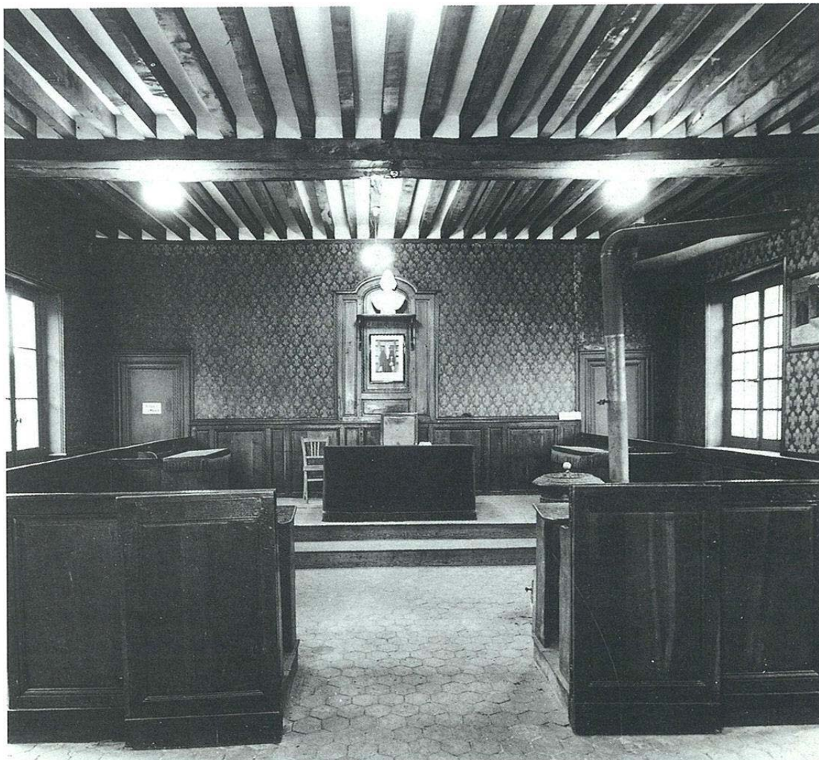
Bailliage de Lyons-La-Foret (Eure) - Salle audience XVIIIe siecle - vue face salle