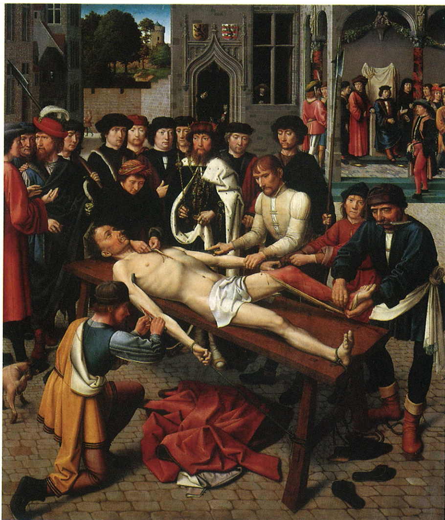
XI. Gérard David, La Justice de Cambyse. L'écorchement . (1498.) (Bruges, musées communaux).