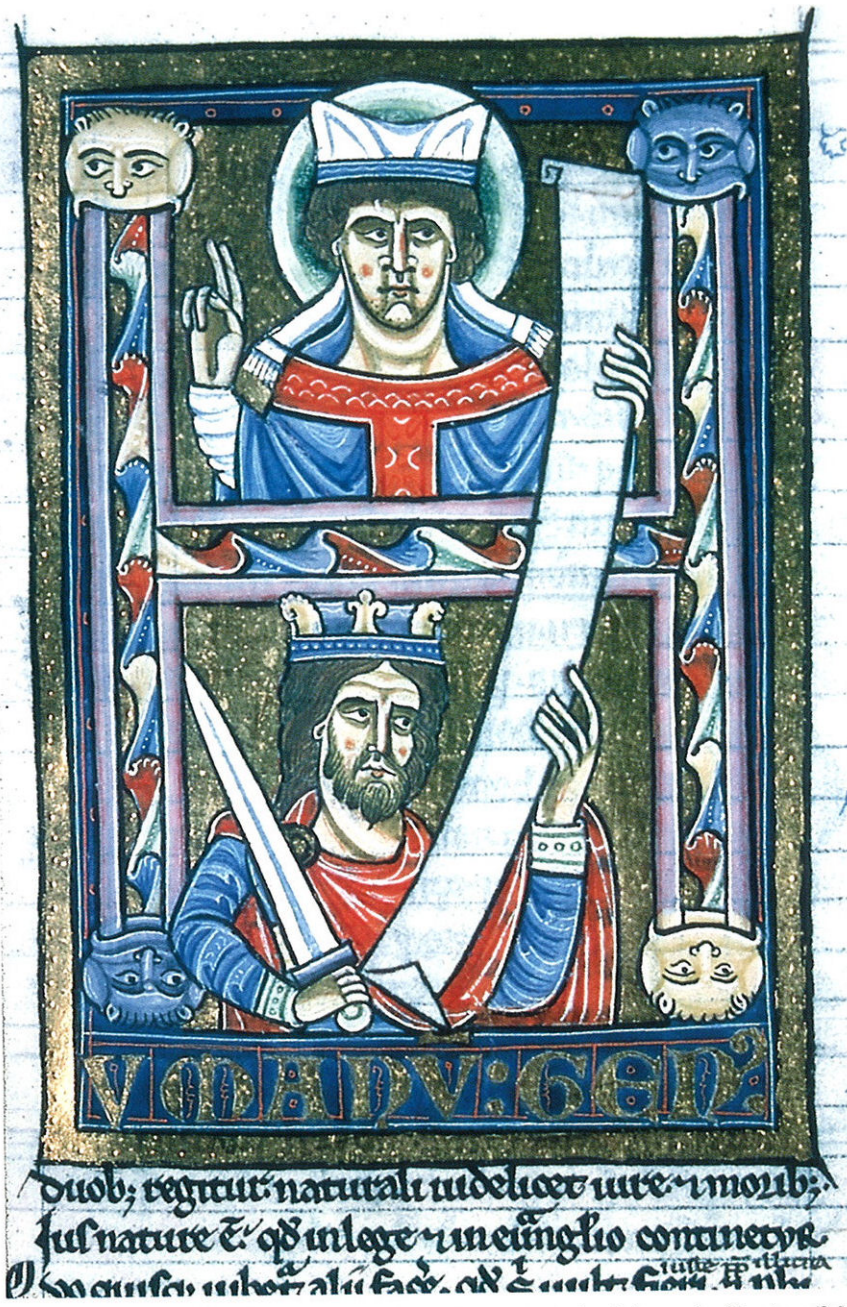
I. Les pouvoirs spirituel et temporel investis par la Loi. (Décret de Gratien, B.M. Troyes, ms. 103, fol. 11, XIII e s.)