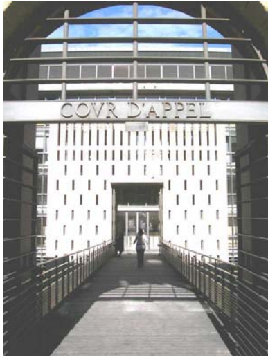
Aix en Provence