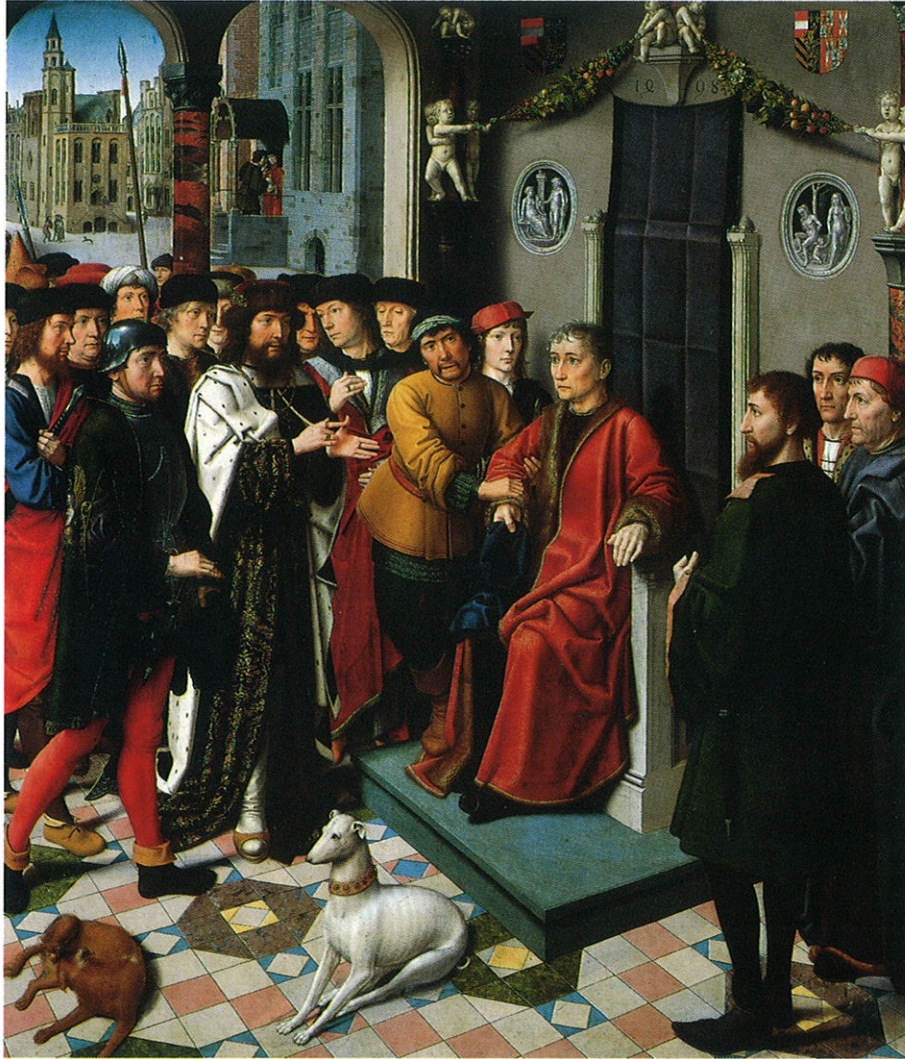
X. Gérard David, La Justice de Cambyse. La destitution du juge corrompu . (1498.) (Bruges, musées communaux).