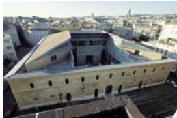
Aix en Provence