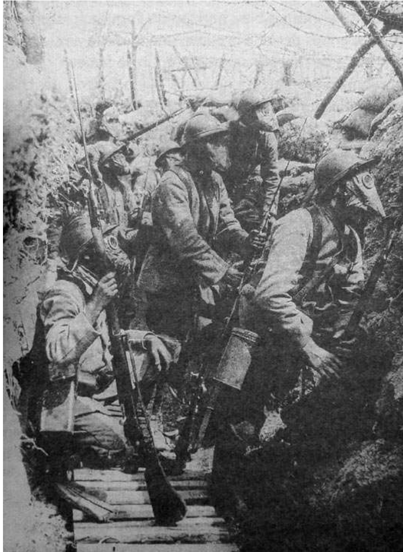
HISTOIRE GEOGRAPHIE 3 ème . Dans une tranchée française avant l'assaut . Paris, collection Martin Ivernel, 2003, p. 22.

Mais la mission semble délicate, voire même impossible car « le seul équivalent de l'image demeure l'image elle-même » (34) et parce que l'analyse ne pourra jamais être exhaustive. Un document contient toujours plus que ce qu'une explication peut révéler comme c'est le cas de cette image de guerre très construite ci-dessous.