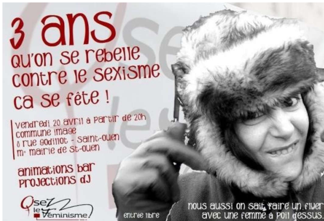
Affiche de la fête organisée à l'occasion des trois ans d' « Osez le féminisme ! »