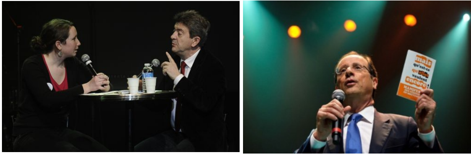
Soirée d'interpellation des candidat-e-s à l'élection présidentielle, le 7 mars 2012 à la Cigale, Paris