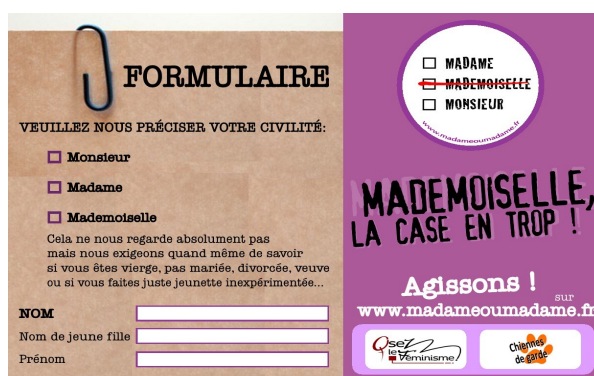
Affiche de la campagne « Mademoiselle, la case en trop ! »

Cette campagne, axée sur un sujet d'ordre administratif, marque une victoire juridique. En effet, une circulaire du premier ministre, datée du 21 février 2012, appelle à faire disparaître des formulaires administratifs la mention « mademoiselle » a profit de « madame » et remplacer la notion de « nom de jeune fille » et « nom d'épouse », par « nom de famille » et « nom d'usage ». Le document précise que « ces mentions ne constituent pas un élément d'état civil » et que « l'emploi de la civilité "Madame" devra être privilégié, comme l'équivalent de "Monsieur" pour les hommes, qui ne préjuge pas de la situation maritale de ces derniers ». De plus, cette campagne de communication bénéficie à son tour d'une large médiatisation – y compris internationale – qui entretient la notoriété du groupe. Ainsi, l'efficacité des actions menées par Osez le féminisme sur le plan médiatique et juridique et le nombre d'adhérents qu'elles lui ont permis d'acquérir ont fait de l'association un mouvement central, voire de « masse » dans l'espace actuel du féminisme. L'association a ainsi pu sensibiliser l'opinion publique à travers ses diverses campagnes de communication, tout en contribuant à remettre les revendications féministes sur l'agenda politique, comme cela a été visible au moment de l'élection présidentielle de 2012. C'est ce qu'affirme Linda, 28 ans, militante active à OLF, pour qui il s'agit d'une « grosse machine militante » :