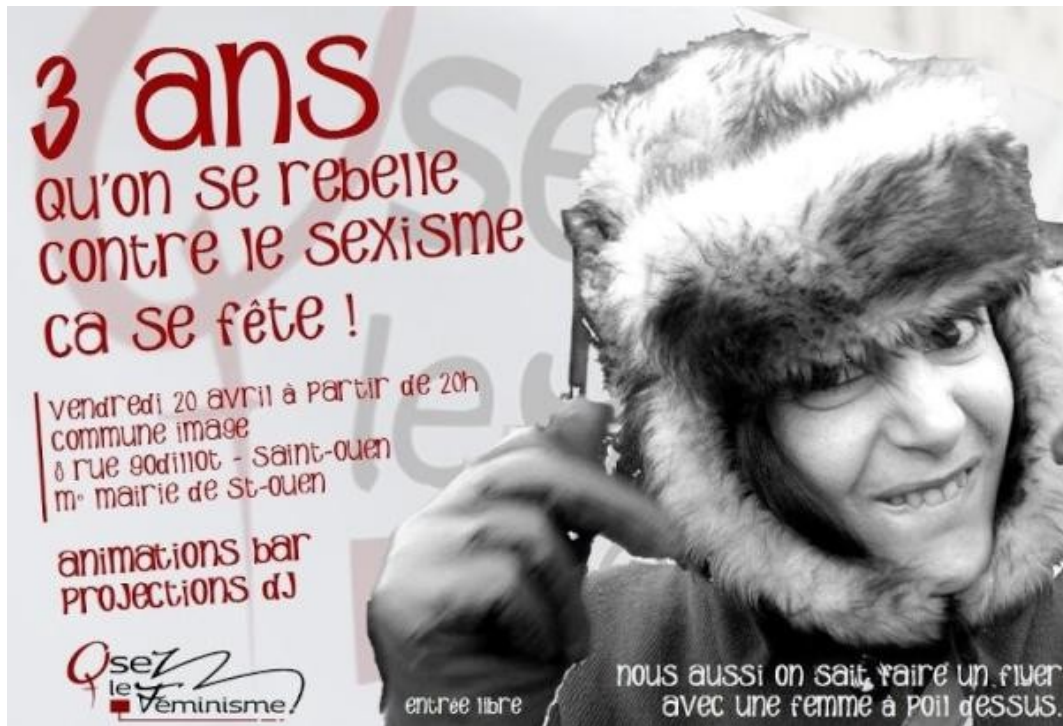
Affiche de la fête organisée à l'occasion des trois ans d' « Osez le féminisme ! »