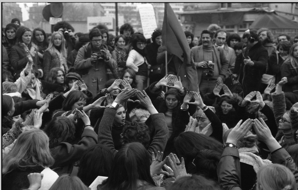
Manifestation du MLF pour l'avortement libre et gratuit, Paris, 25 novembre 1972.

L'Hymne des femmes est un chant qui est apparu lors du Mouvement de Libération des Femmes (MLF) dans les années 1970. Les paroles sont anonymes ; l'air est emprunté au célèbre « Chant des marais ». Cet hymne est régulièrement chanté à l'occasion de manifestations féministes, par exemple lors de la Journée Internationale des Droits des Femmes le 8 mars. En voici les paroles 58 :