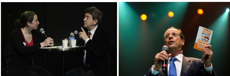
Soirée d'interpellation des candidat-e-s à l'élection présidentielle, le 7 mars 2012 à la Cigale, Paris