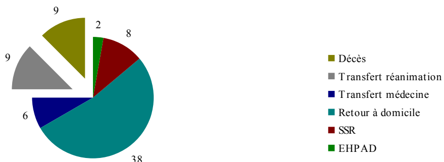
Figure 1: Evolution et pronostic des patients présentant une hyponatrémie < 120 mmol/l (n = 72)

L'évolution des patients est représentée dans la figure 1.