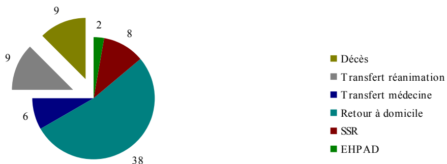
Figure 1: Evolution et pronostic des patients présentant une hyponatrémie < 120 mmol/l (n = 72)

L'évolution des patients est représentée dans la figure 1.