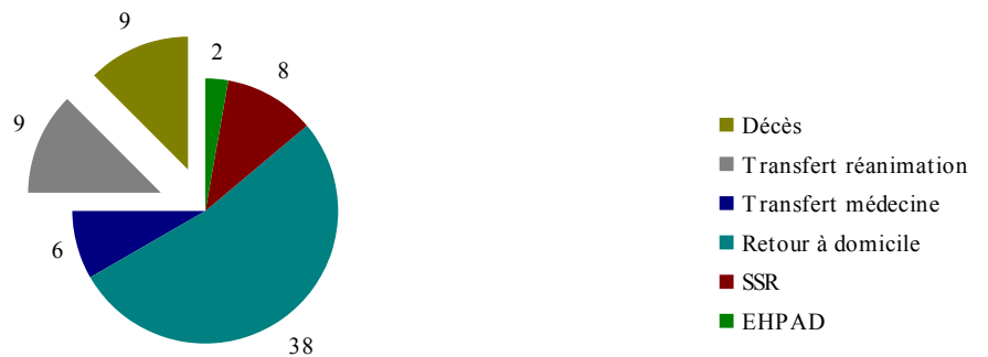
Figure 1: Evolution et pronostic des patients présentant une hyponatrémie < 120 mmol/l (n = 72)

L'évolution des patients est représentée dans la figure 1.