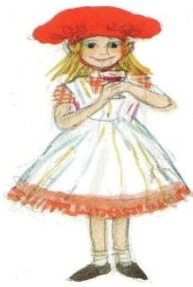
Le petit chaperon rouge