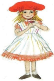
Le petit chaperon rouge