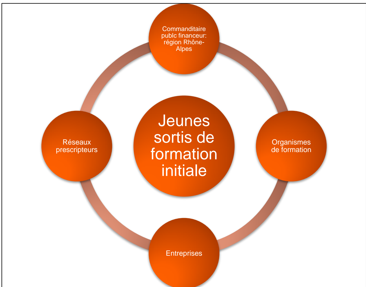
Figure 3 : Modélisation schématique des interdépendances entre acteurs du PFE