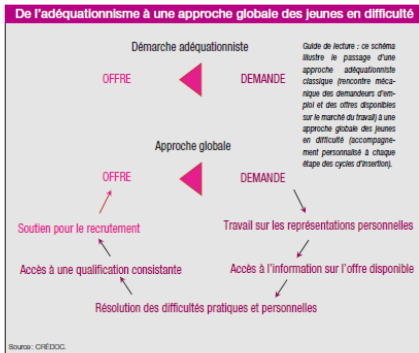
Figure 1 : La dynamique de deuxième chance des jeunes en difficulté

Au sein d'une dynamique de deuxième chance, la formation occupe un rôle central par sa capacité à doter les individus de compétences correspondant à des attentes professionnelles. Le dispositif étudié dans ce mémoire, le Projet Formation Emploi (PFE), fait le pari d'une formation longue, soutenue et consistante (sanctionnée par un diplôme) pour des jeunes sans qualification, tout en menant des actions sur les autres aspects mentionnés par l'approche globale (travail sur les représentations personnelles, accès à l'information sur l'offre disponible, rencontre des difficultés pratiques et personnelles, soutien pour le recrutement).